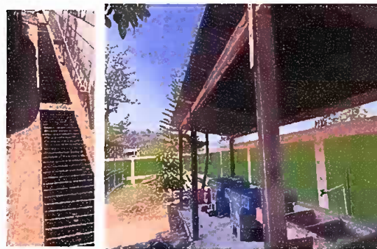
Foto 6: sustitución de teberia de aguas negras, pinturas en paredes

Observación: Si es necesario se pueden agregar hojas adicionales y actualizar el número de hojas.