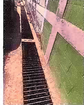
Foto 2: sustitución de parrilla metálica de la cuneta del ingreso principal del centro educativo y la reparación de la cuneta de concreto.