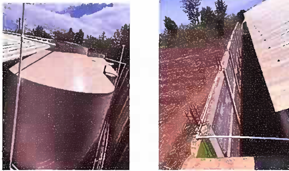
Foto1: Situación de un tinaco + sustitución de la tubería de la línea principal de agua potable de servicios sanitarios