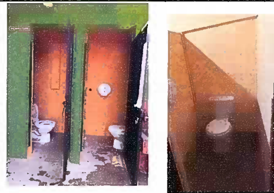
Foto 4: sustitución de los inodoros, tapaderas de inodoros y pintado en las paredes de los baños