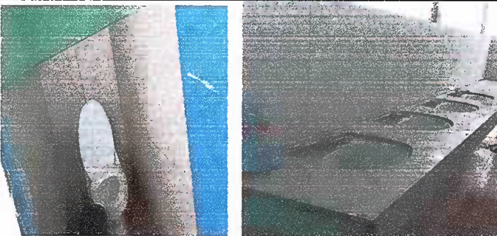
Foto 11: MODULO 3. Aplicacion de azulejo en paredes de sanitarios y lavamanos