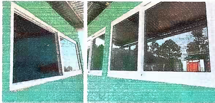
Foto 7: MODULO 2 Sustitución de ventanas de aluminio por ventanas PVC, sustitución de lamparas a tipo LED y sustitución de tomacorrientes dobles