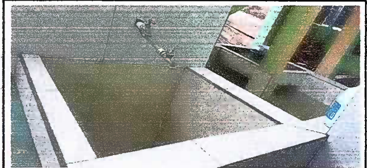
Foto 12: Sustitución de pila de cemento de dos lavadero por una formal. Aplicacion de azulejo en pila de concreto

Observación: Si es necesario se pueden agregar hojas adicionales y actualizar el número de hojas.