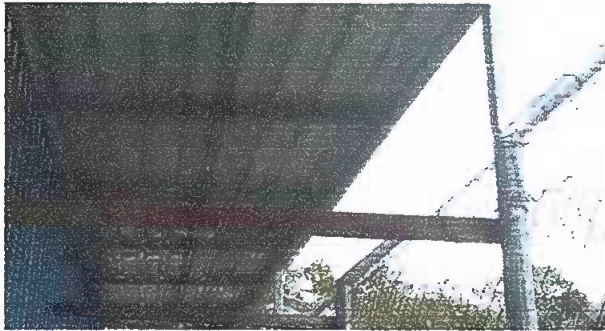
Foto 9: MODULO 2. Sustitución de estructura de soporte de madera, por metal. Sustitución de lámina, por lámina troquelada aluzinc calibre 26.