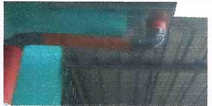
Foto 8: MODULO 2. Sustitución de canal de pvc por metal, Sustitución de bajada de agua pluvial de PVC