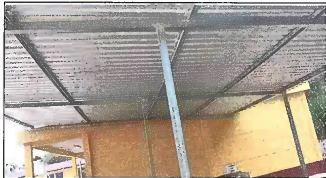
Foto1: Sustitución de lámina, por lámina troquelada aluzinc calibre 26.