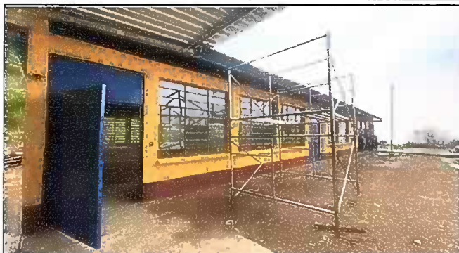
Foto 2: Sustitución de vidrios y mantenimiento a puertas (lijado y pintura)