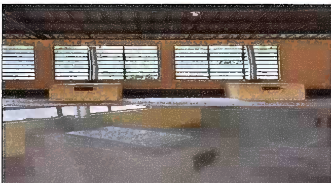
Foto 4: Mantenimiento a estufa rural, chimenea y sustitución de plancha de metal