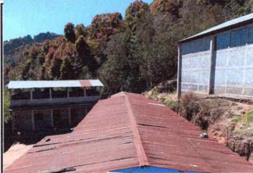
Foto1: Sustitución de lámina, por lámina troquelada aluzinc calibre 26.