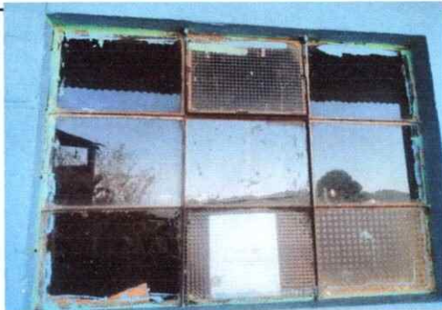
Foto 5: Sustitución de vidrios, estructura de metal y balcones de ventanas.