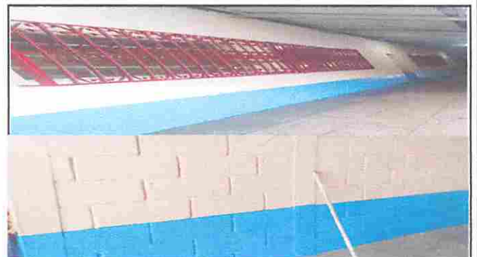
Módulo 2 : Pintura en muros exteriores e interiores