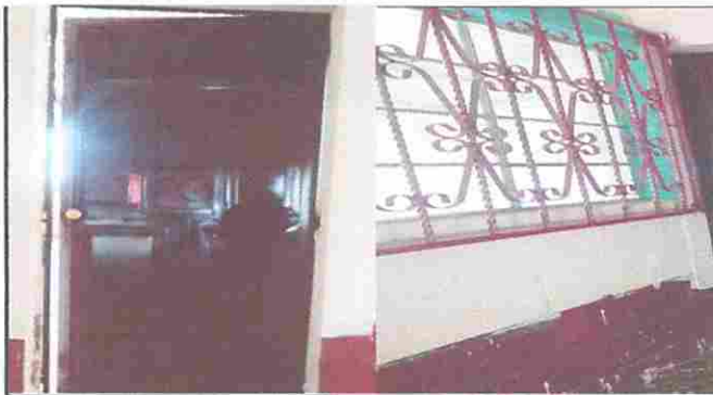
Módulo 1: Sustitución de puerta y Pintura en muros exteriores e interiores