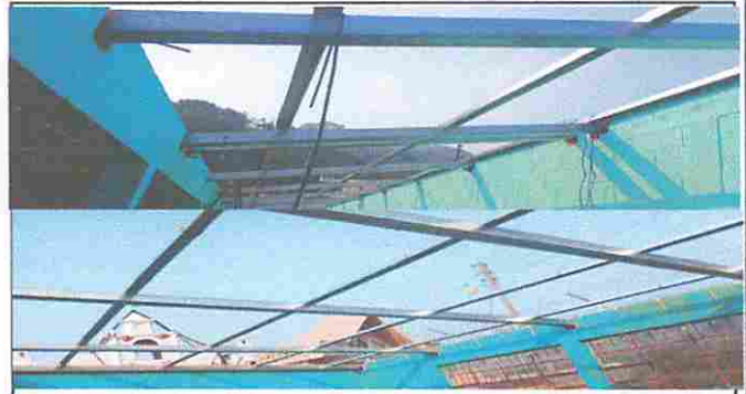
Módulo 1: Sustitución de elementos de fijación y Sustitución de estructura de soporte de madera, por metal