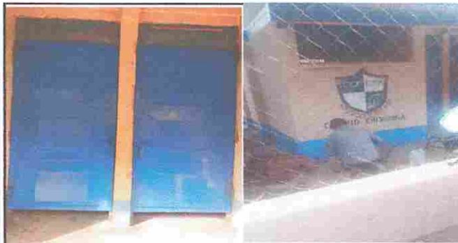
Módulo 3: Mantenimiento a estructura (lijado, cambio de tubo , cepillado, sujeciones, aplicación de pintura) y Pintura en muros exteriores e interiores