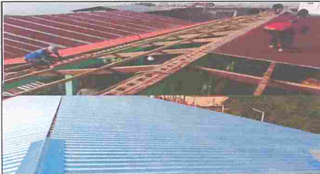
Módulo 1: Sustitución de lámina, por lámina troquelada aluzinc calibre 26 y Sustitución de capote de lámina para lámina troquelada