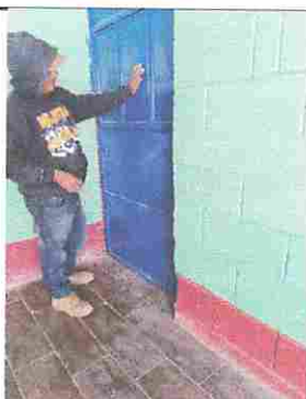
Foto 5: Mantenimiento a estructura (lijado, cambio de tubo, cepillado, sujeciones aplicación de pintura)