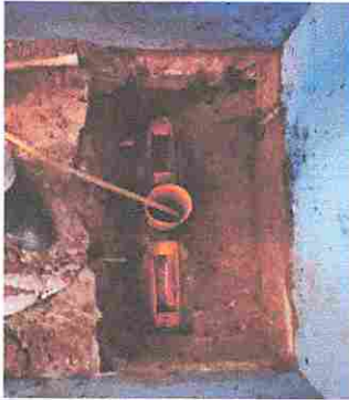
Foto1: Sustitución de inodoro