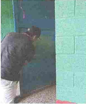
Foto1: Mantenimiento a estructura de metal de puertas