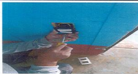
Foto 3: En Proceso Sustitución de Interruptores