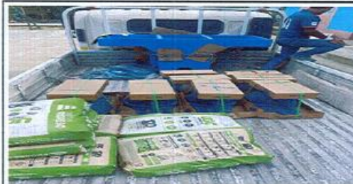
FOTO 6: En Proceso de Sustitución de pila de cemento de dos lavaderos

Observación: Si es necesario se pueden agregar hojas adicionales y actualizar el número de hojas.