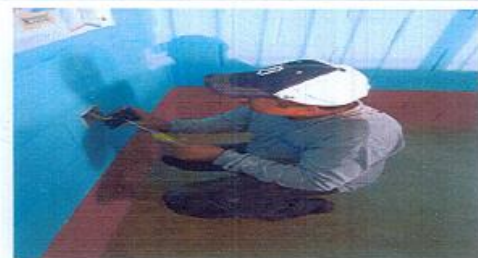
Foto 4: En Proceso Sustitución de Tomacorrientes