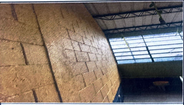
Modulo 2: Pintura en muros exteriores e interiores