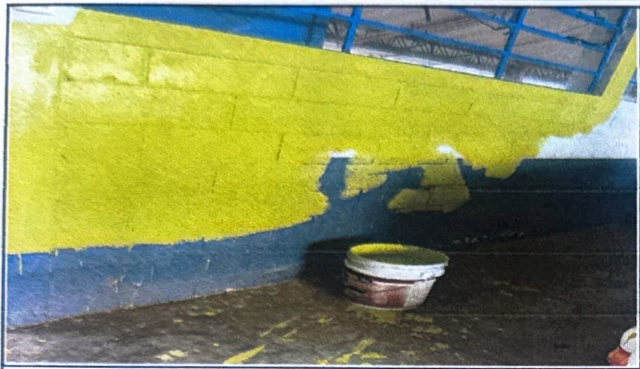
Modulo 1: Pintura en muros exteriores e interiores