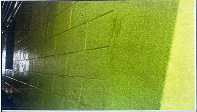
Modulo 2: Pintura en muros exteriores e interiores