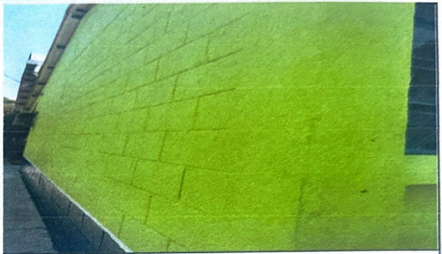
Modulo 1: Pintura en muros exteriores e interiores