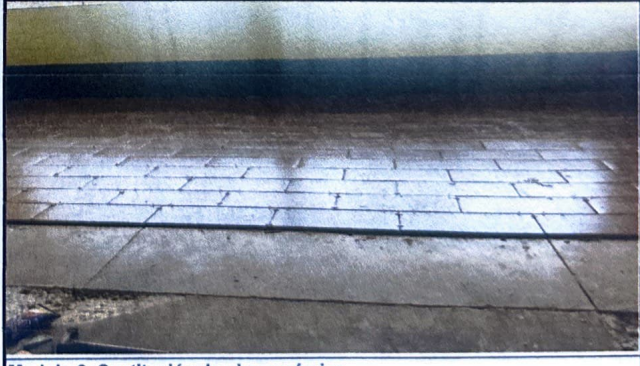
Modulo 2: Sustitución de piso cerámico

Observación: Si es necesario se pueden agregar hojas adicionales y actualizar el número de hojas.