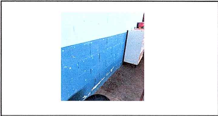
Modulo 2: Pintura en muros exteriores e interiores