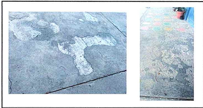
Modulo 2: Sustitución de piso cerámico

Observación: Si es necesario se pueden agregar hojas adicionales y actualizar el número de hojas.