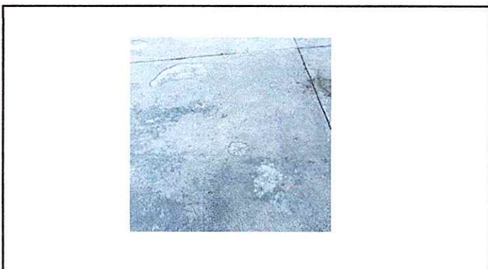
Modulo 1: Sustitución de piso cerámico