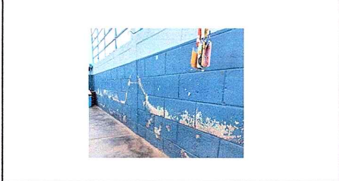
Modulo 1: Pintura en muros exteriores e interiores