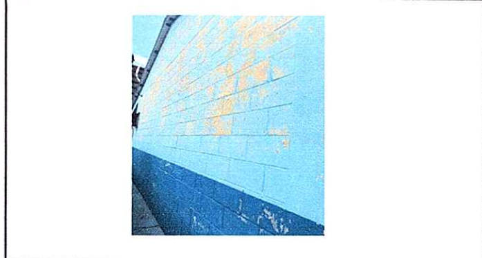
Modulo 1: Pintura en muros exteriores e interiores