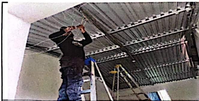
Foto 5: Módulo No. 1 Sustitución de focos ahorradores. Sustitucion de plafoneras. Sustitución de interruptores simples. Instalación de tomacorrientes dobles. Instalación de fliplon. Reparación de cableado eléctrico.