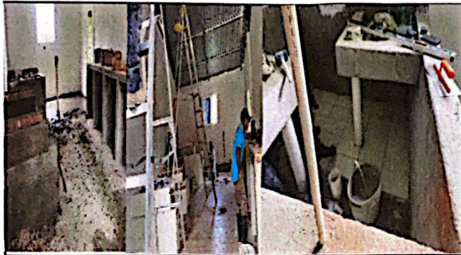
Foto 3: Módulo No. 1 Sustitución de piso de torta de concreto, por piso ceramico. Sustitución de pila de cemento de 2 lavaderos.