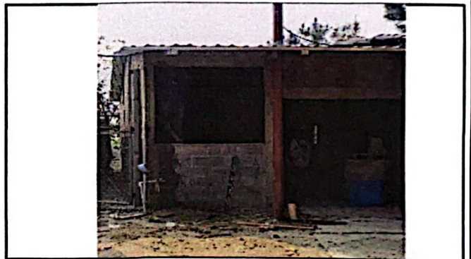
Foto 4: Módulo No. 1 Sustitución de puerta de de madera por metal de dos hojas. Sustitucion de puerta de madera por metal