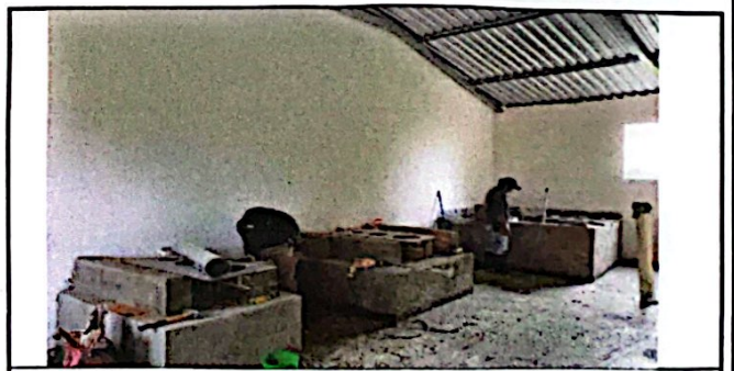
Foto 6: Módulo No. 1 Sustitución de estufas rurales (completa) Incluye chimenea y plnchas de metal. Instalación de azulejo en estufas rurales.

Observación: Si es necesario se pueden agregar hojas adicionales y actualizar el número de hojas.