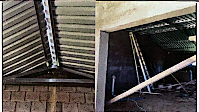
Foto 2: Módulo No. 1 Sustitución de de lámina, por lámina troquelada. Instalación de capote de lámina, para lámlia troquelada. Instalación de elementos de fijación