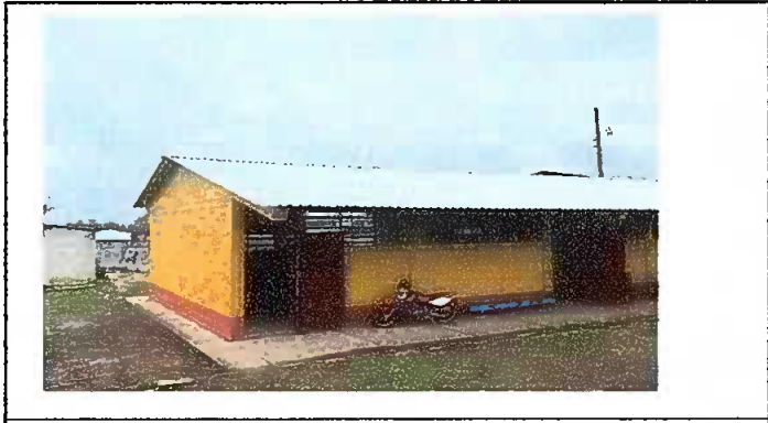
Foto1: cambio de techado de modulo 3