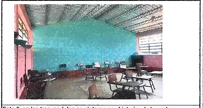
Foto 6: en los tres modulos se pintaron en el interior de las aulas.

Observación: Si es necesario se pueden agregar hojas adicionales y agregar el número de las hojas.