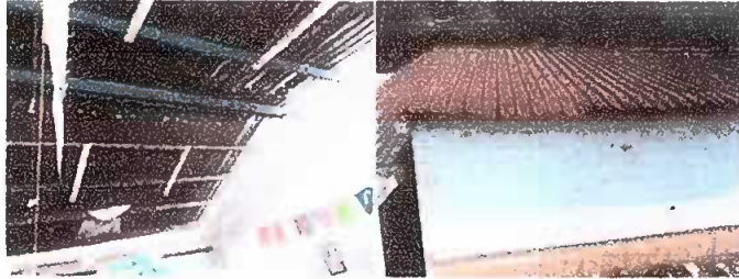
Módulo 1: sustitución de lámina por lámina troquelada Cal. 26