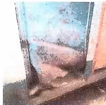
Módulo 3: sustitución de puerta de metal por metal

Observación: Si es necesario se pueden agregar hojas adicionales y actualizar el número de hojas