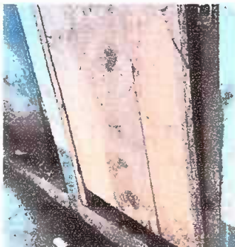
Módulo 3: Sustitución de puertas