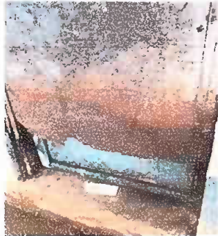
Módulo 3: Sustitución de puertas de metal por metal