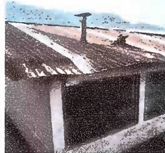
Modulo 2: Sustitución de lamina por lamina troquelada Cal. 26