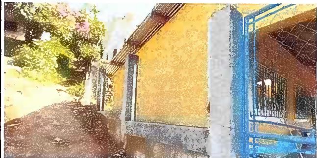
Foto1: MURO PERIMETRAL 10 MT