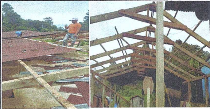
Foto1: desinstalacion de lamina existentes