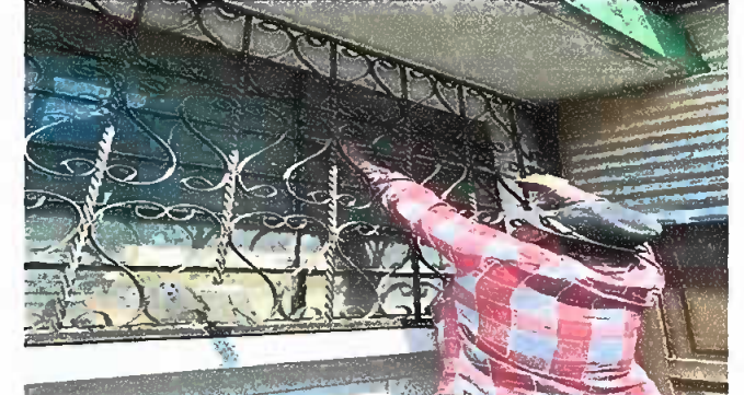
Foto : 5.5 SITUACIONES DE VIDRIOS 20 UNIDADES