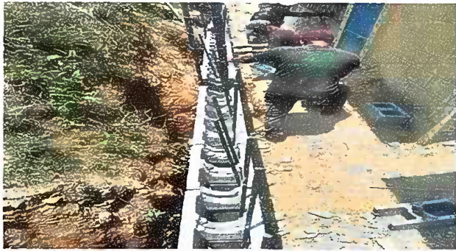
Foto1: 22.1 Reparacion de muros de contencion 63 ML