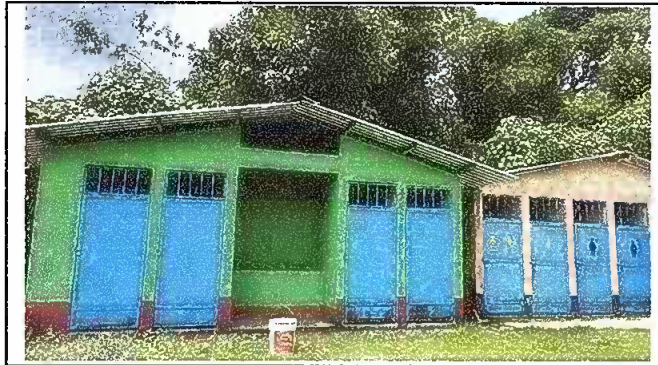
Foto 7: Sustitución de lámina, por lamina troquelada aluzinc calibre 26