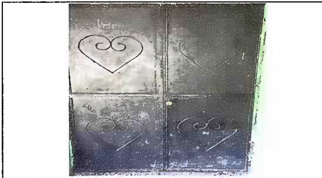
Foto1: Mantenimiento a portones de metal