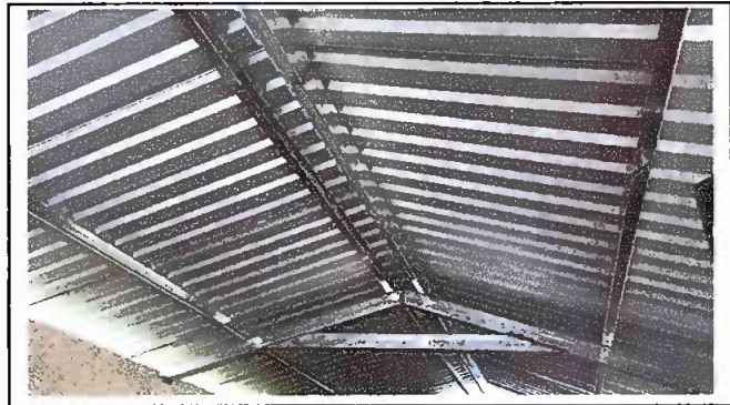
Foto 2: Sustitucion de estructura de soporte de madera, por metal