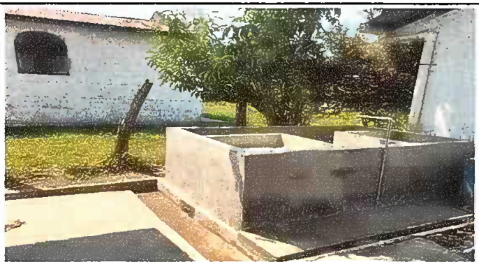
Modulo 1: Sustitución de pila de cemento de dos lavaderos.