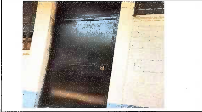
Modulo 2: mantenimiento a estructura de puerta