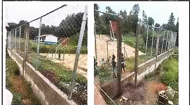
Reparacion de muro perimetral de block con tubo hg y malla galvanizada, soleras intermedia y columnas.

Observación: Si es necesario se pueden agregar hojas adicionales y actualizar el número de hojas.