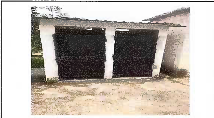
Modulo 3: mantenimiento a estructura de puerta de baños