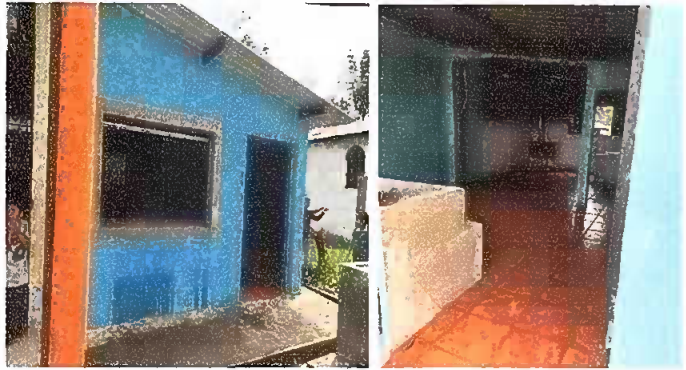
Modulo 1 : Apertura de vano mas tallado y suministro de una mesa de concreto