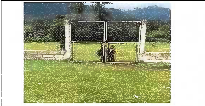
Sustitucion de porton de malla