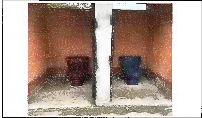
Modulo 3 sustitucion de inodoro e instalacion de tuberia pvc aguas negras