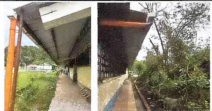
Modulo 2: reparacion de bajada de agua pluvial , tubo pvc3"y sustitución de pescante para canal