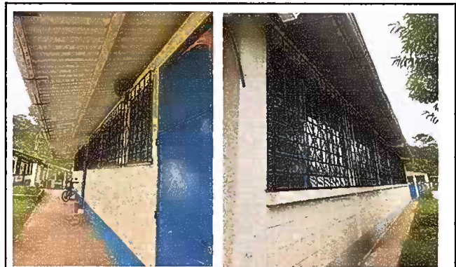
Modulo: 4 Instalacion de balcones de metal