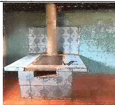
Modulo 1 : sustitucion de plancha de metal y sustitucion de chimenea de concreto