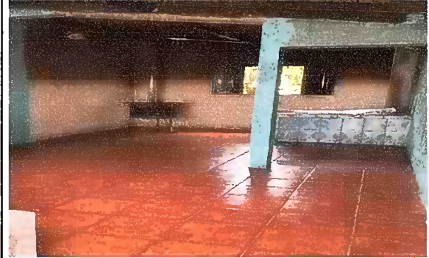
Modulo 1: Sustitucion de base nueva y colocacion de piso ceramico