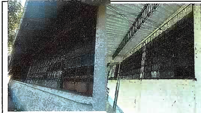
Modulo 2: sustitucion de vidrios

Observación: Si es necesario se pueden agregar hojas adicionales y actualizar el número de hojas.