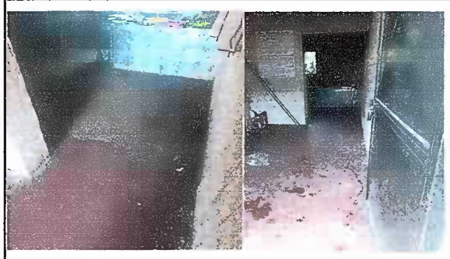
Modulo 1: Sustitucion de base nueva y colocacion de piso ceramico