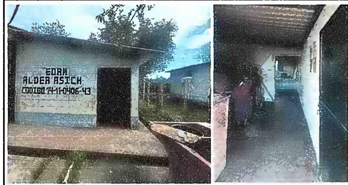
Modulo 1 : Apertura de vano mas tallado y suministro de una mesa de concreto