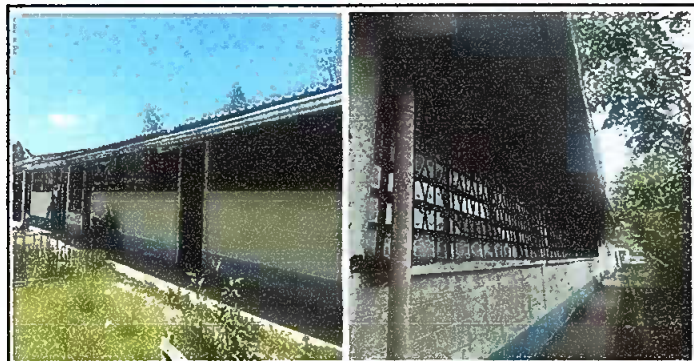
Modulo 2: reparacion de bajada de agua pluvial , tubo pvc3"y sustitución de pescante para canal