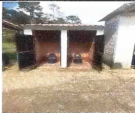
Modulo 3 sustitucion de inodoro e instalacion de tuberia pvc aguas negras