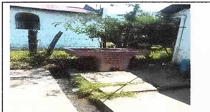
Modulo 1: Sustitución de pila de cemento de dos lavaderos.