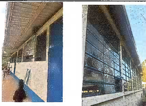
Modulo: 4 Instalacion de balcon de metal