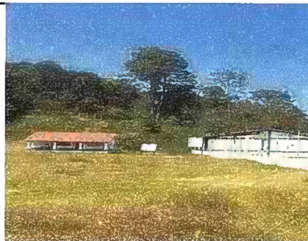
Reparacion de muro perimetral de block con tubo hg y malla galvanizada, soleras intermedia y columnas.

Observación: Si es necesario se pueden agregar hojas adicionales y actualizar el número de hojas.