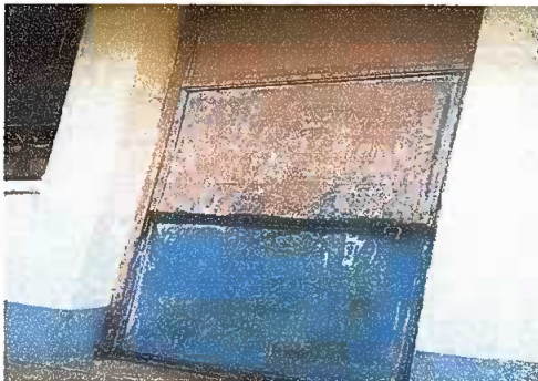
Modulo 2: mantenimiento a estructura de puerta