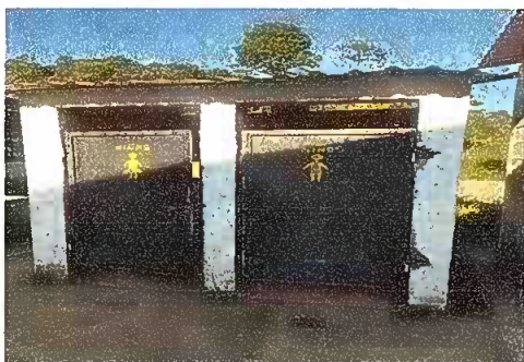
Modulo 3: mantenimiento a estructura de puerta de baños