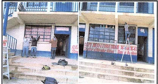
Foto 4 Modulo 3. Suministro y colocación de balcon de hierro en ventana.