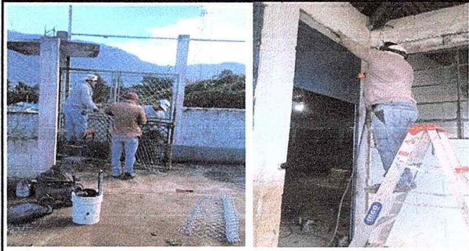
Foto 1 de Modulo 1: Mantenimiento a estructura de porton de metal(lijado,sepillado sujeciones, aplicación de pintura y cambio de malla hg). Sustitucion de puertas de metal por metal.