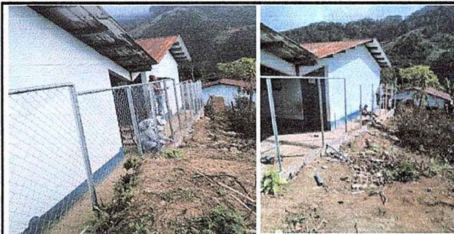
Foto 5 del Modulo:4 Reparación de circulación perimetral con tubo hg malla galvanizado.