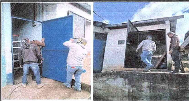
Foto 3 del Modulo 2. Sustitución de puertas de metal por metal.