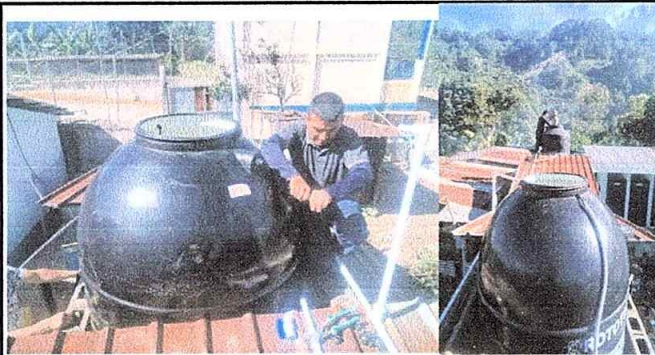
Foto 9 de Modulo 4: Sustitución de deposito de agua. Sustitución de accesorios de depositos de agua.