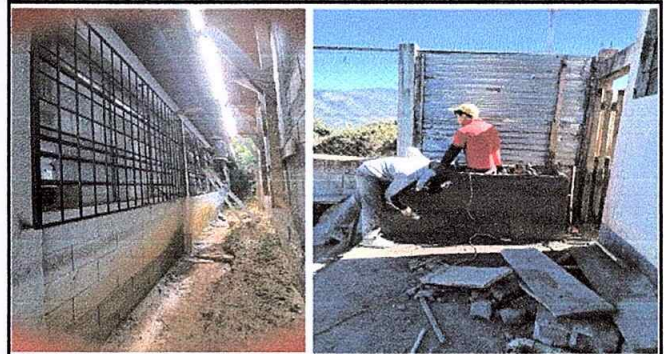
1 Foto 2 de Modulo 1: Suministro y colocación de balcon de hierro. Sustitución de pila de concreto.