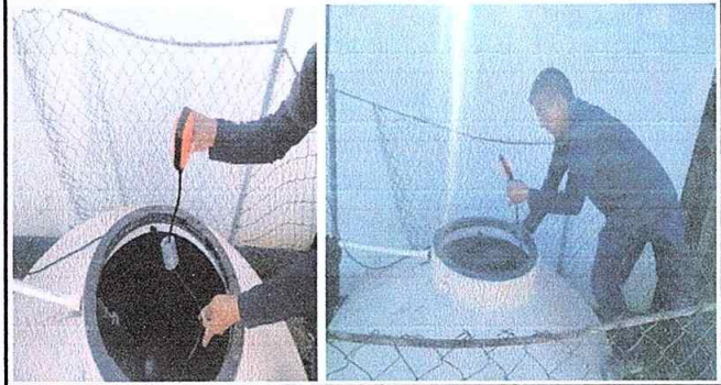
foto 8 de Modulo 4 : Sustitución de accesorios de deposito de agua.