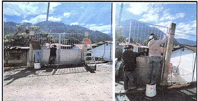
Foto 6 del Modulo 4 Sustitución de porton de metal.

Observación: Si es necesario se pueden agregar hojas adicionales y actualizar el número de hojas.