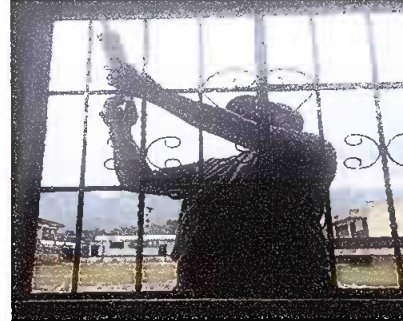
Módulo 1: Suministro e instalación de estructura de cerramiento. Suministro e instalación de laminas troqueladas.