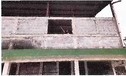
Módulo 1: Suministro e instalación de ventanas. Suministro e instalación de balcones.