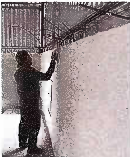
Módulo 1: Suministro e instalación de repello.