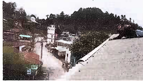
Módulo 1: Suministro de canales y bajada pluvial.