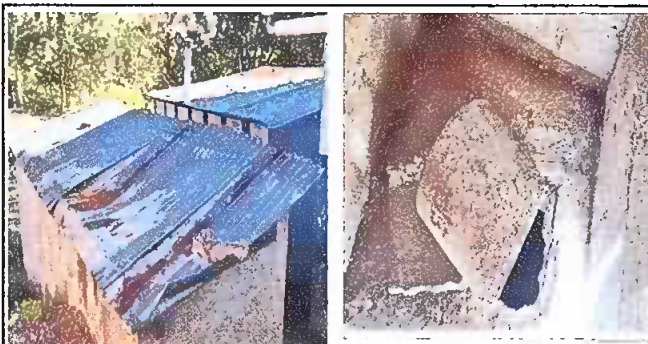
Foto 5: Sustrucción de láminas para baños y letrina. También se determina la reparación de los tubos de drenajes.