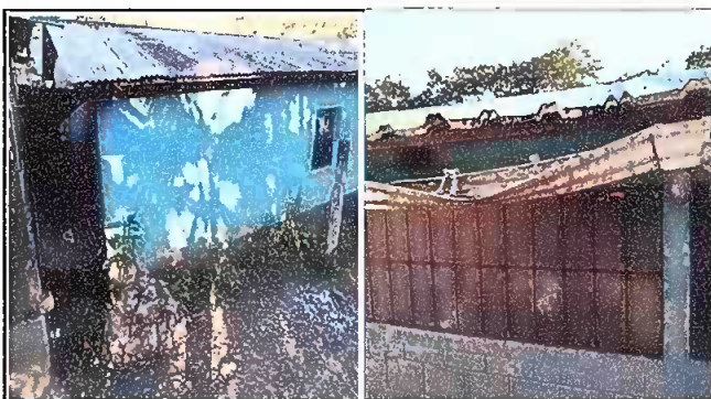
Foto 4: Sustrucción de techos de 46 láminas para 2 aulas y 9 canales de plástico..