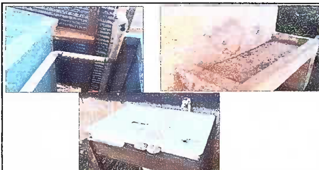
Foto 6: Sustrucción de tubos y colocación de chorros para lavamanos. Y se sustituye lavamanos de plástico por una pila de cemento.

Observación: Si es necesario se pueden agregar hojas adicionales y actualizar el número de hojas.