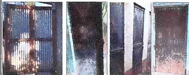
Foto1: Sustrucción de puerta de lámina de ingreso al centro educativo y de 4 puertas de metal para aulas, 1 puerta de metal para bodega, 1 puerta de metal para dirección, 3 puertas de metal y 3 puertas de madera para baños, 1 puerta de metal para cocina.