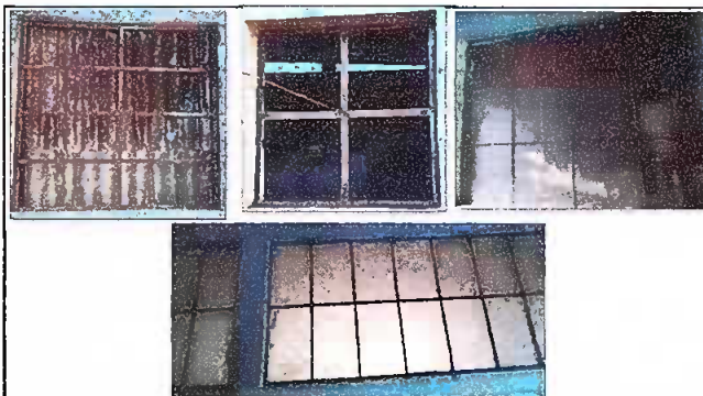
Foto 2: Sustrucción de ventanas de vidrios y balcones para 4 aulas, 1 para la dirección y 2 para la cocina.