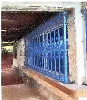
Foto 1: Sustrucción de perçiana de metal a vidrio reflectivo azul y balcón.