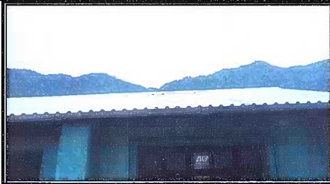
Foto 2: sustitucion de lamina ,por lamina troquelada aluniz calibre