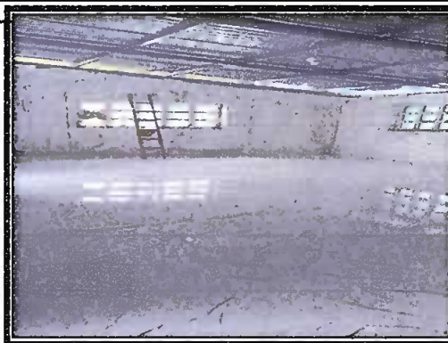
Foto 4: sustitucion de piso de torta de concreto por piso ceramico