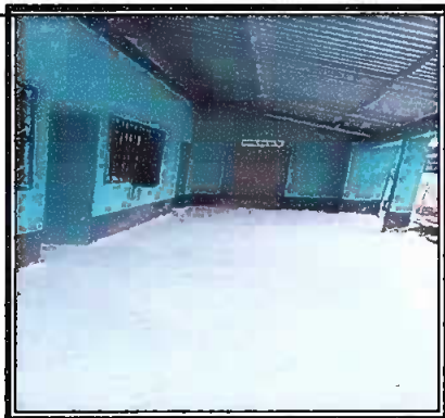
sustitucion de piso de torta de concreto por piso ceramico