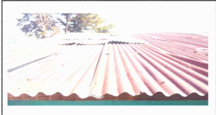
Foto1: sustitución de Lámina, por Lámina Troquelada Alizinc Calibre 26