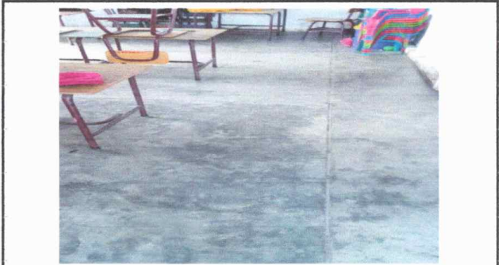
Foto 2: Sustitucion de Piso de Torta de Concreto por piso ceramico