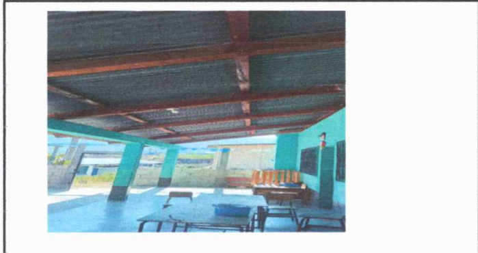
Sustitución de estructura portante de madera, por metal