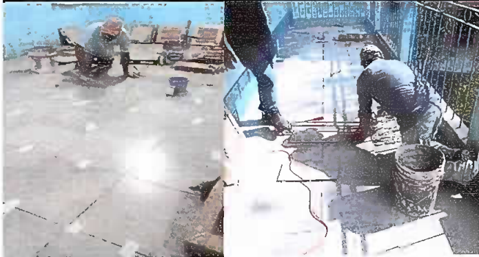
Modulo 1: Colocación de piso Cerámico