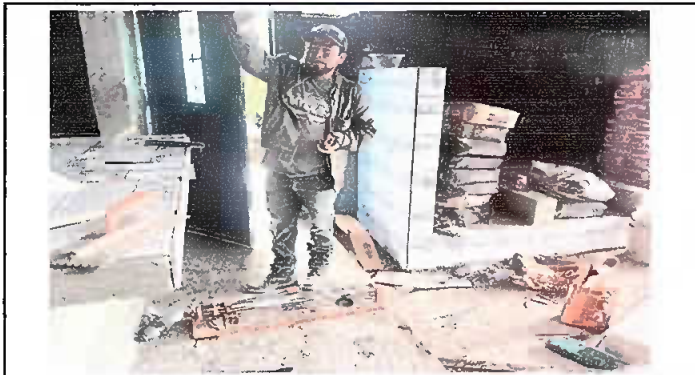
Modulo 2: Sustitución de top de concreto IN SITU e instalación de azulejo a estufa rural.