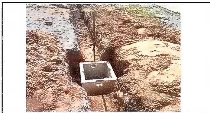
Modulo 3: Colocación de tubería y línea principal.

Observación: Si es necesario se pueden agregar hojas adicionales y actualizar el número de hojas.