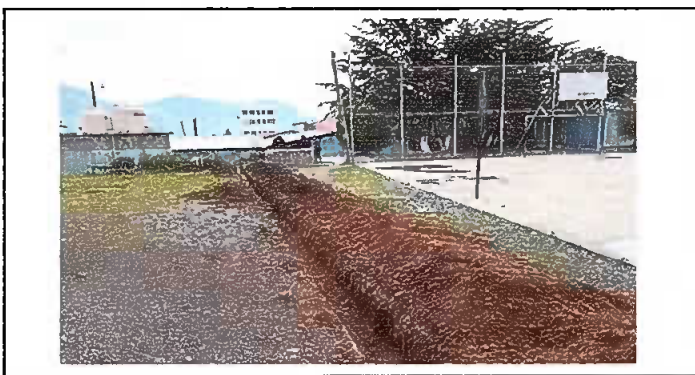
Modulo 3: Sustitución de tubería de línea principal.