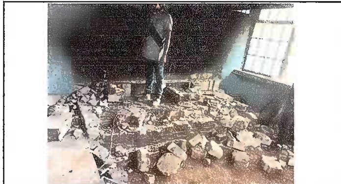
Modulo 2: Sustitución de estufa rural.