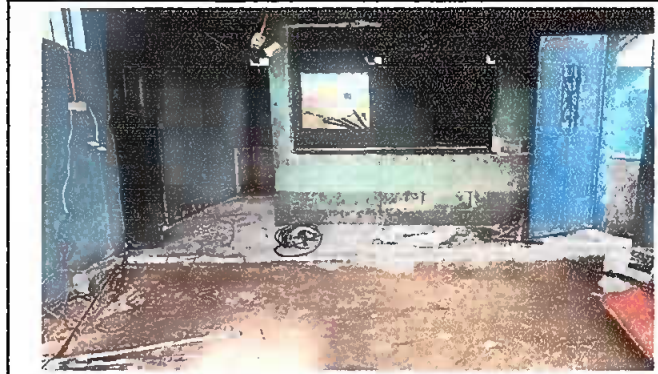
Modulo 2: Proceso sustitución de piso en torta y muro.