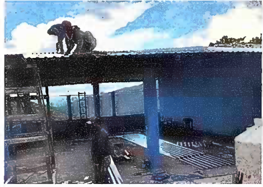
Foto 2: Módulo 1 (Sustitución de lámina, por lámina troquelada aluzinc c. 26)