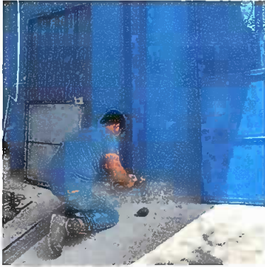
Foto1: Módulo 1 (Sustitución de puerta de metal en módulos)