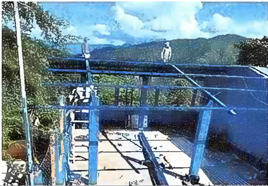
Foto 3: Módulo 1 (Sustitución de estructura de soporte de madera por metal)