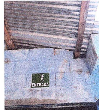
Foto 2: Módulo 1 (Sustitución de lámina, por lámina troquelada aluzinc c. 26)