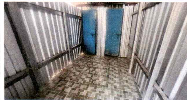
Foto 5: Se puede constatar la instalación de piso cerámico antideslizante en servicios sanitarios. Se confirma una correcta práctica de instalación.