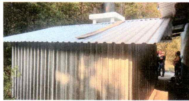
Foto 3: Se verifica la instalación de cubierta de metal, estructura portante y muros de lámina troquelada calibre 26