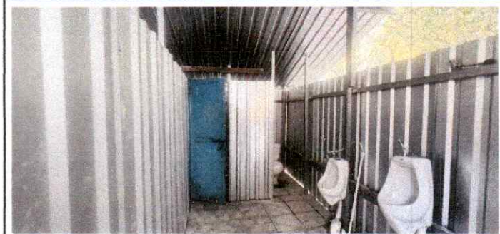
Foto 4: Se verifica la instalación de artefactos sanitarios tipo mingitorios en los servicios sanitarios