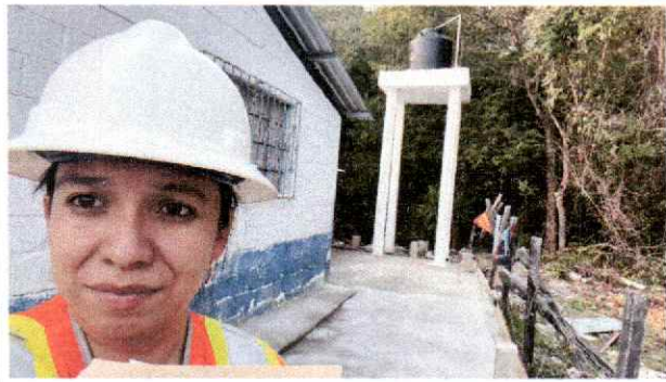
Foto 1: Evaluadora de campo inicia con el recorrido para verificar avances en el edificio educativo beneficiado.