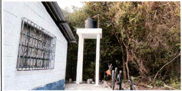
Foto 2: Puede verificarse el suministro de estructura e instalación de tinaco y mejoramiento de red hidráulica