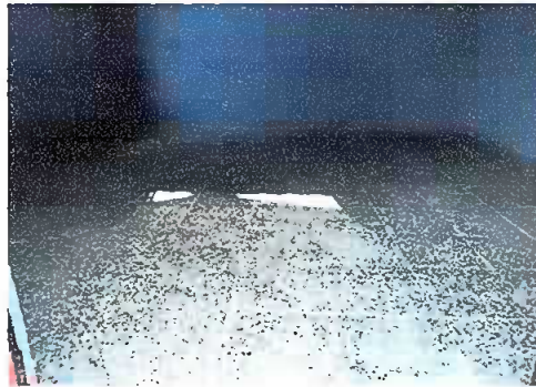
Foto 1: Módulo 2. Piso, se observa el piso de granito finalizado en la dirección.