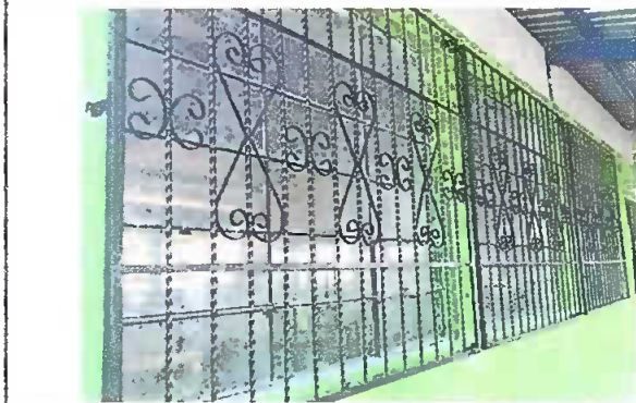
Foto 1: Modulo 1. Ventana, se observan balcones instaladas en cada ventana de las aulas