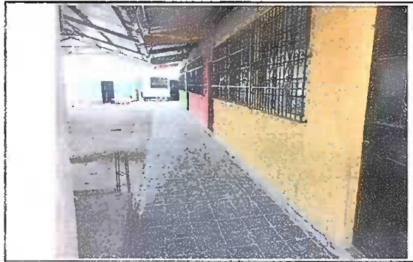
Foto 6: Modulo 1. Patio, se observa el piso de granito finalizado.

Observación: Si es necesario se pueden agregar hojas adicionales y actualizar el número de hojas.