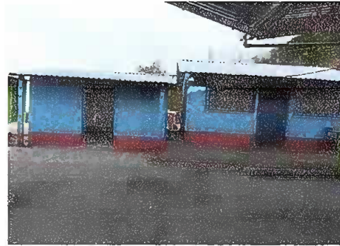
Foto 4. PINTURA GENERAL, se observa pintura en la parte exterior de dirección y cocina.

Observación: Si es necesario se pueden agregar hojas adicionales y actualizar el número de hojas.