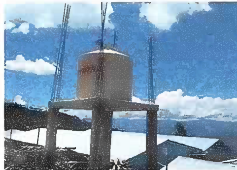
Foto 1: PATIO. Se observa la base de concreto finalizado para deposito de agua de 2,500 litros.