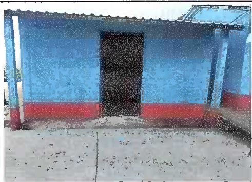
Foto 1. PINTURA GENERAL, se observa pintura en la parte exterior de la dirección.