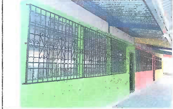
Foto 2: Modulo 1. Ventana, se observan tres aulas con nueve balcones de la parte de enfrente.