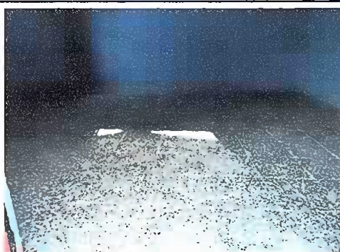
Foto 2. PINTURA GENERAL, se observa pintura en la parte interior de la dirección.