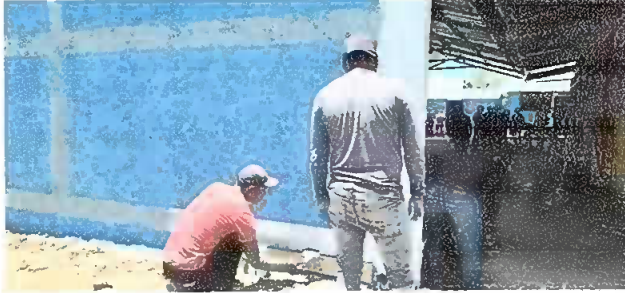
Foto 5. PINTURA GENERAL, se observa pintura en la parte exterior del escenario.