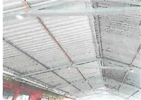
Foto 2: Módulo 4. Cableado eléctrico y accesorios, se observan la instalación del cableado eléctrico y accesorios.