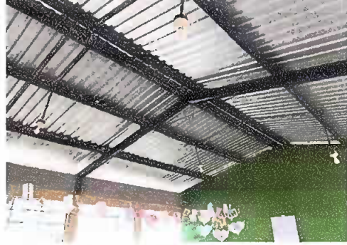
Foto 8: Módulo 1. Focos ahorradores, se observan focos ahorradores en cada aula.