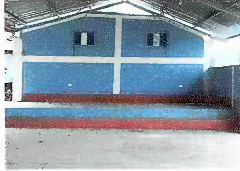
Foto 6. PINTURA GENERAL, se observa pintura en la parte interior del escenario.