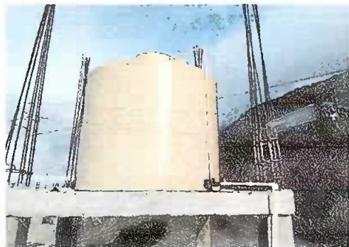
Foto 1: PATIO. Se observa el deposito de agua de 2,500 litros instalado en la base.