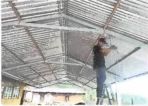
Foto 1: Módulo 4. Cableado eléctrico y accesorios, se observan la instalación del cableado eléctrico y accesorios..