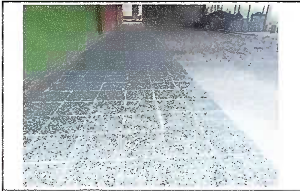
Foto 5: Modulo 1. Patio, se observa piso granito instalado en el patio.