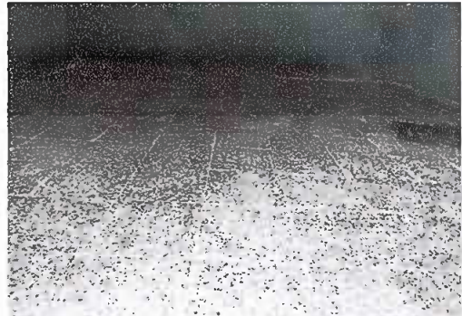
Foto 2: Módulo 2. Piso, se observa el piso de dirección finalizado.