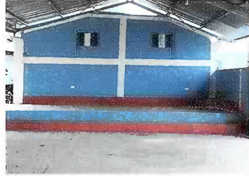
Foto 4: Módulo 4. Muro por block, se observa el muro y base del escenario finalizado. .