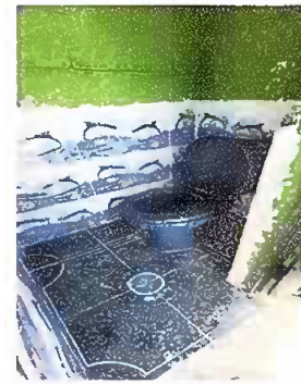
Foto 2: Módulo 3. Inodoro, se observa inodoro nuevo e histada con todo accesorios.

Observación: Si es necesario se pueden agregar hojas adicionales y actualizar el número de hojas.