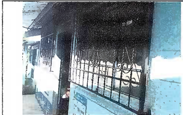
Foto 4: Modulo 1. Ventana, se observan dos ventanas instaladas en la cocina.