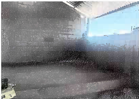
Foto 3: Módulo 4. Muro por block, se observa el muro y base del escenario finalizado.