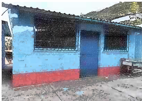
Foto 3. PINTURA GENERAL, se observa pintura en la parte exterior de la cocina.