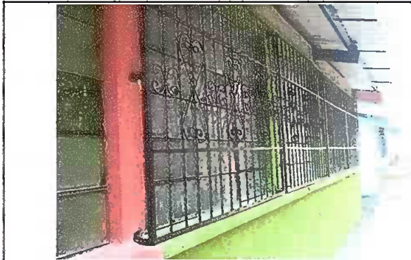
Foto 3: Módulo 1. Ventana, se observan cuatro balcones de la parte posterior de una aula.