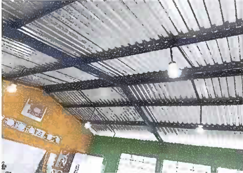
Foto 7: Módulo 1. Focos ahorradores, se observan cuatro focos instaladas en cada aula.