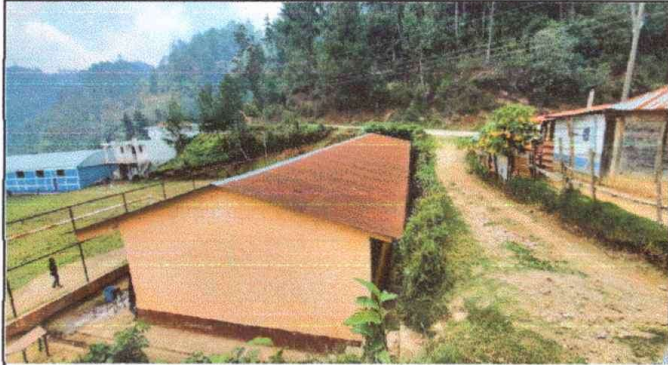
Foto1: Módulo 1: Sustitución de Lámina por Lámina Troquelada calibre 26