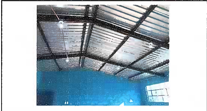
Foto1: Modulo 1 (Mantenimiento de estructura)