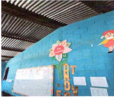
Foto1: Modulo 1 (Mantenimiento de estructura)