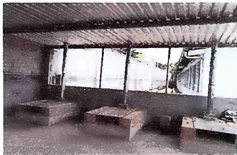
Foto1: Sustitución de estufa rural (incluye chimenea y plancha de metal)