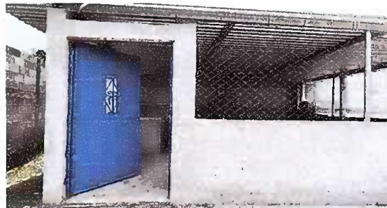
Foto 2: Sustitución de lámina, por lámina troquelada aluzinc calibre 26