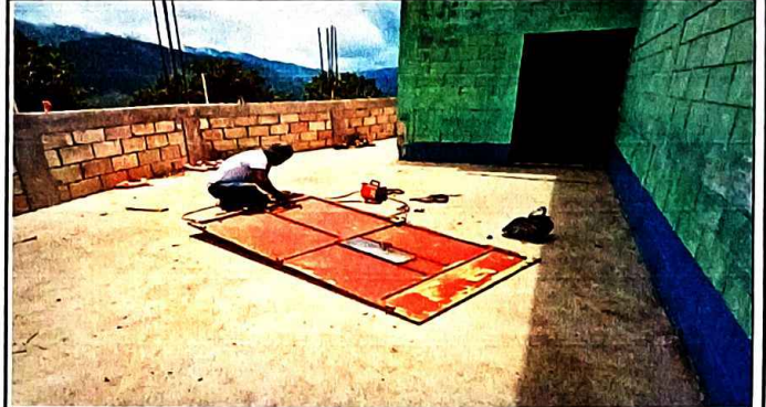
Foto 2 Reparación de puertas