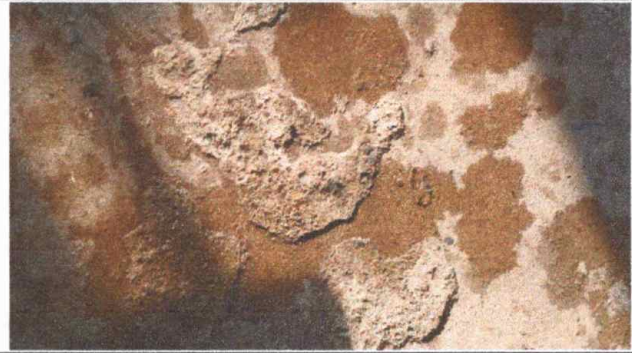
Foto 2: MODULO 2: Sustitución de piso de torta por piso cerámico.