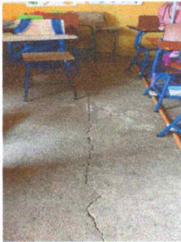
Foto 3: MODULO 1: Sustitución de piso de torta por piso cerámico.