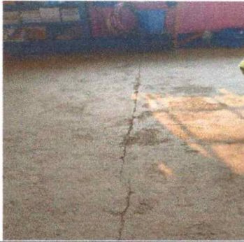
Foto 1: MODULO 1: Sustitución de piso de torta por piso cerámico.