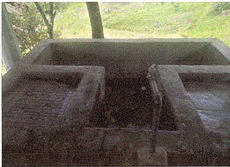
Foto 3: MODULO 2. Sustitución de pila de concreto de dos lavaderos IN SITU