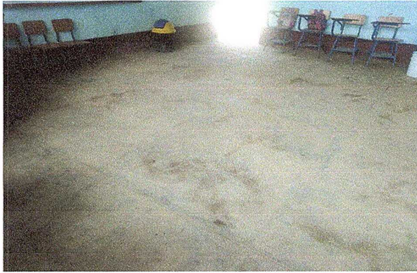
Foto1: MODULO 1. Sustitución de piso de torta de concreto por piso cerámico