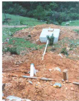
Foto 5: Tubería de aguas negras, se necesita trasladar el revalse a otra fosa.