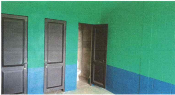
Foto 3: Suministro de lavamanos, en el area de servicios sanitarios