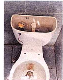
MODULO 4 Sustitucion de inodoro, sustitucion de accesorios de inodoro

Observación: Si es necesario se pueden agregar hojas adicionales y actualizar el número de hojas.