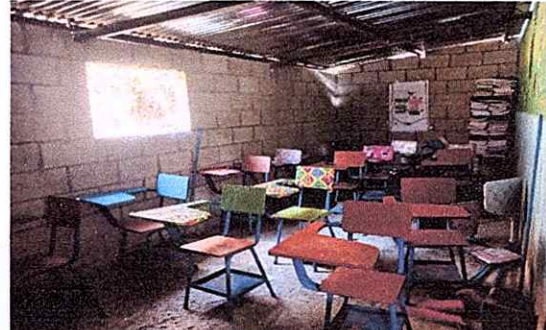
MODULO 3 Repello de muros, sustitucion de piso ceramico, sustitucion de plafoneras, sustitucion de interruptor, sustitucion de ventanas, sustitucion de puertas de madera por metal, sustitucion de canal PVC