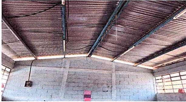
MODULO 1 sustitucion de capote de lamina para lamina canaliada, mantenimiento de puerta completo, lijado, sustitucion de vidrios, sustitucion de valcones.