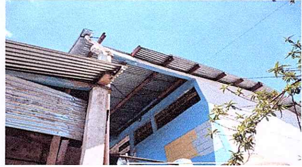
MODULO 1 Sustitucion de lamina por lamina troquelada