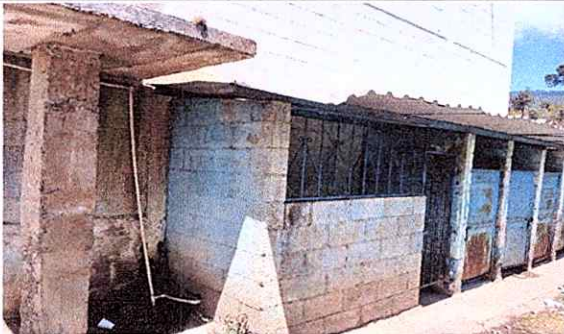
MODULO 4 Mantenimiento a puertas completo, sustitucion de tuberia PVC linea principal de agua entubada, sustitucion de grifos de lavamanos, sustitucion de un tinaco 1700 ML. Sustitucion de accesorios