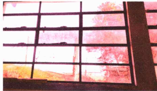
Modulo 1: Sustitución vidrios de ventanas