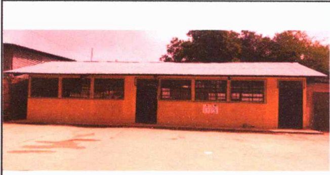
Modulo 1: Repello en paredes de aulas