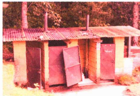
Modulo 2: Mantenimiento de estructura de puertas del servicio sanitario

Observación: Si es necesario se pueden agregar hojas adicionales y actualizar el número de hojas.