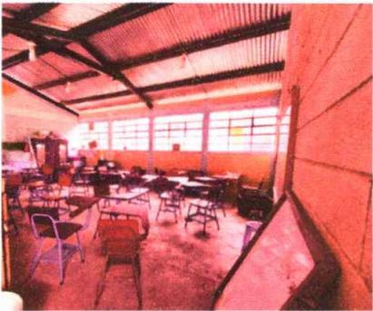
Modulo 1: Sustitución de torta de concreto