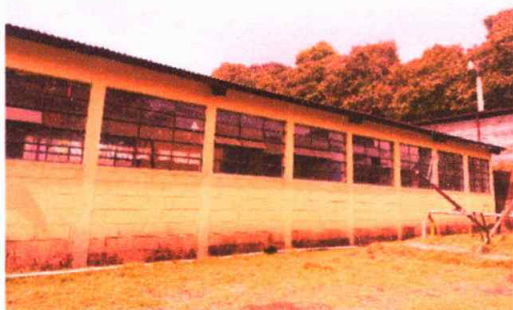
Modulo 1: Sustitución vidrios de ventanas