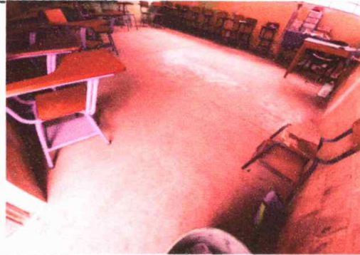
Modulo 1: Sustitución de torta de concreto