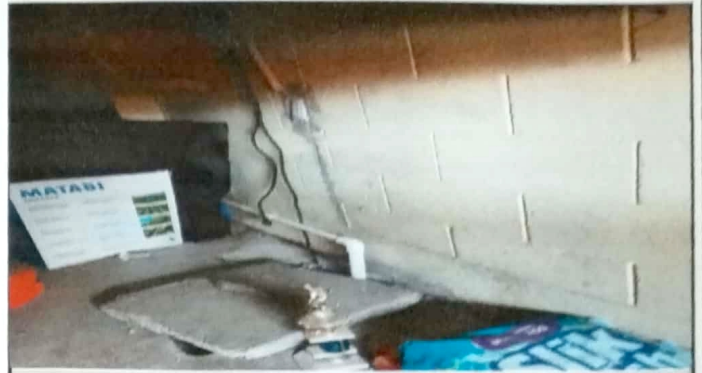
Modulo 2: Sustitución de bomba de agua 1 hp truper.