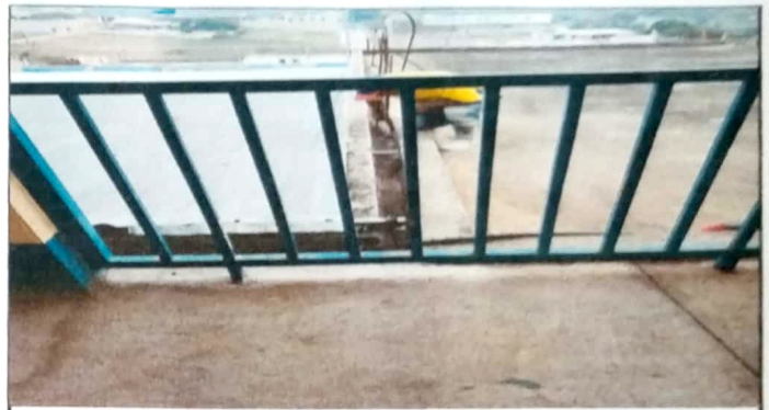
Modulo 2: Impermeabilizante.