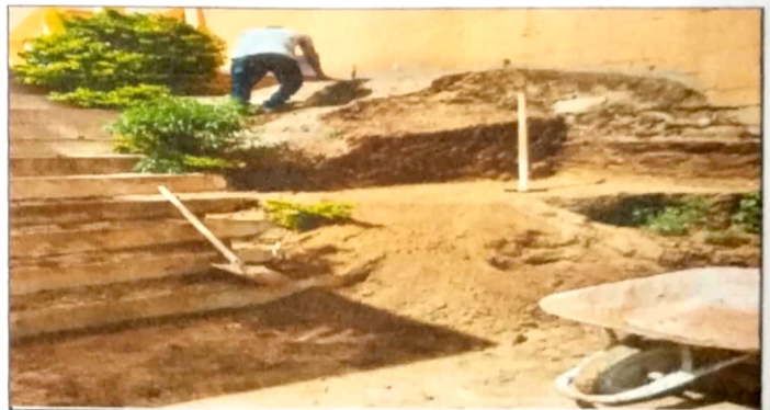
Modulo 1: Construcción de muro de contención paralelo a gradas del Ingreso No. 1

Observación: Si es necesario se pueden agregar hojas adicionales y actualizar el número de hojas.