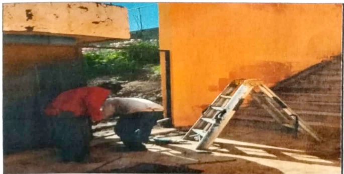
Modulo 1: Sustitución de puerta de madera por una de metal.