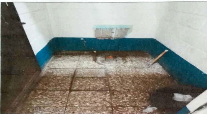
Modulo 2: sustitución de inodoros y accesorios.