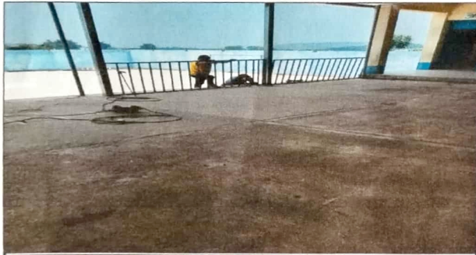
Modulo 1: Suministro e instalación de baranda.