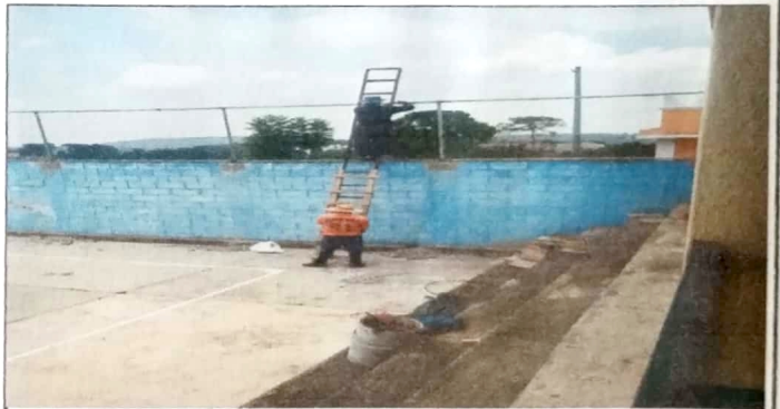
Modulo 1: Reparación de tubo hg y malla en muro.