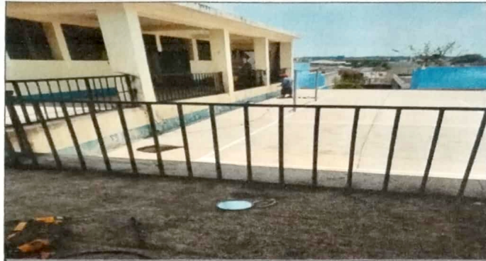
Modulo 1: Reparación de baranda.