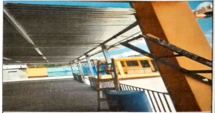
Modulo 1: sustitucion de canal pvc