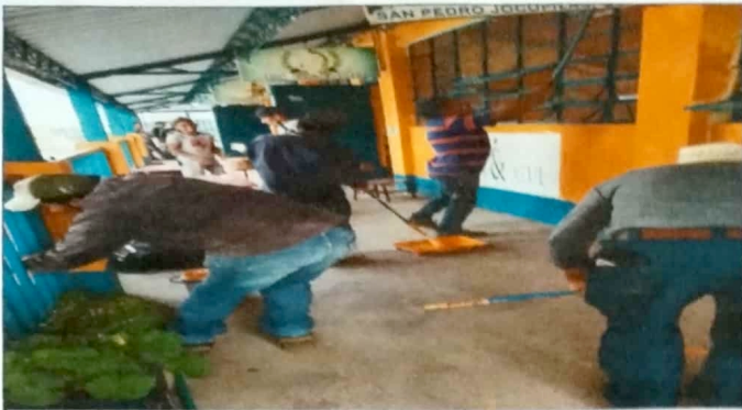
Modulo 2: Sustitución de pintura general en muros exteriores e interiores.