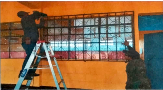
Modulo 3: suministro e instalación de balcones.