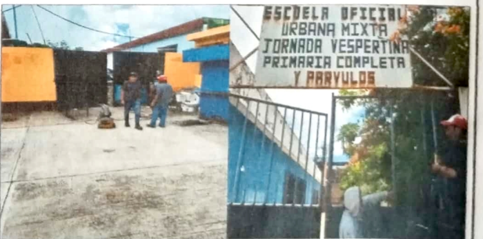
Modulo 1: Mantenimiento a portones de metal..

Observación: Si es necesario se pueden agregar hojas adicionales y actualizar el número de hojas.