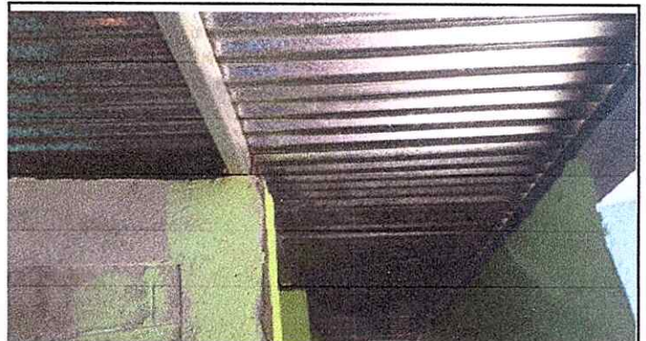
MODULO 2: SUSTITUCIÓN DE LAMINA POR LAMINA TROQUELADA ALUZINC CALIBRE 26