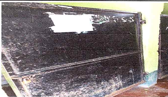
MODULO : 2 MANTENIMIENTO DE PUERTAS