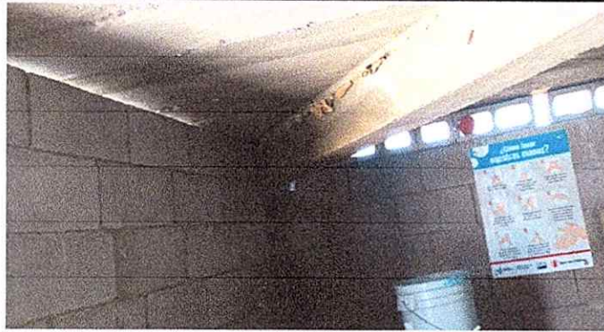
MODULO 1: REMODELACIÓN DE PAREDES Y TERRAZA