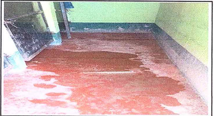
MODULO 1: CAMBIO DE PISO LISO POR CERAMOCO Y AZULEJO