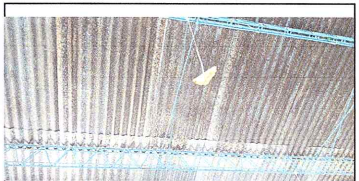
MODULO 2: SUSTITUCIÓN DE LAMINA POR LAMINA TROQUELADA ALUZINC CALIBRE 26

Observación: Si es necesario se pueden agregar hojas adicionales y actualizar el número de hojas.