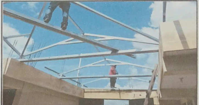
Foto 4: Sustitución de estructura de metal y lámina por estructura de metal y lamina troquelada aluzinc calibre 26