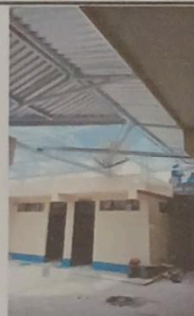
Foto 5: Sustitución de estructura de metal y lámina por estructura de metal y lamina troquelada aluzinc calibre 26