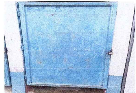
Foto 18 Módulo 3: Mantenimiento a estructura de puerta lijado y aplicación de pintura

Observación: Si es necesario se pueden agregar hojas adicionales y actualizar el número de hojas.