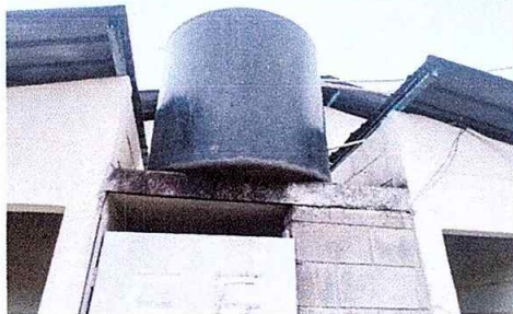
Foto 17 Módulo 3: Sustitución de depósito de agua No.2 (1700 LTS)