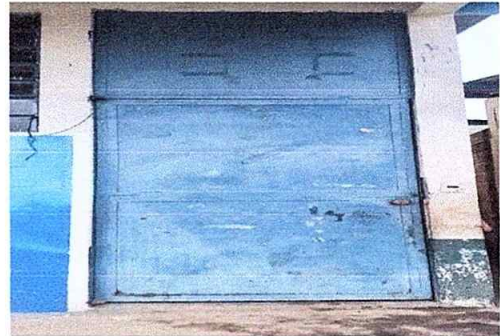
Foto 10 Módulo 2: mantenimiento a estructura de puerta lijado y aplicación de pintura