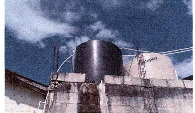
Foto 16 Módulo 3: Sustitución de depósito de agua No. 1 (1700 LTS)