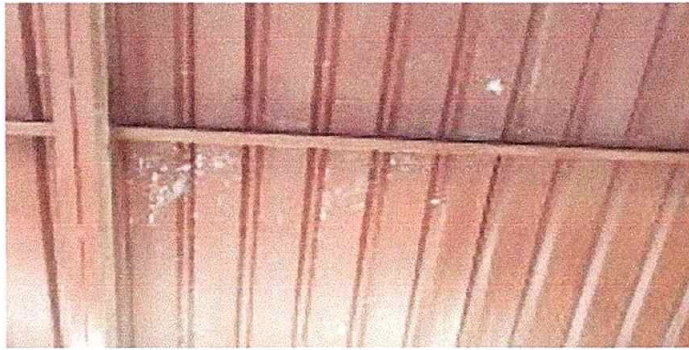
Foto 3 Módulo 1: Sustitución a estructura de soporte de metal por metal