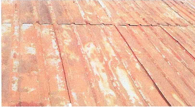
foto 1 Módulo 1: Sustitución de lámina por lámina troquelada aluzinc cal 26