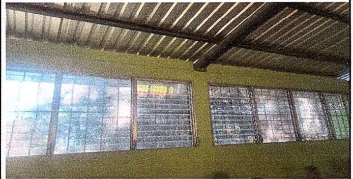
Modulo 3: foto4 sustitucion de vidrios.