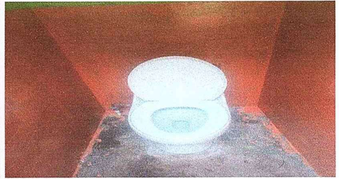
Modulo 4: fot.4 Sustitucion de inodoro.