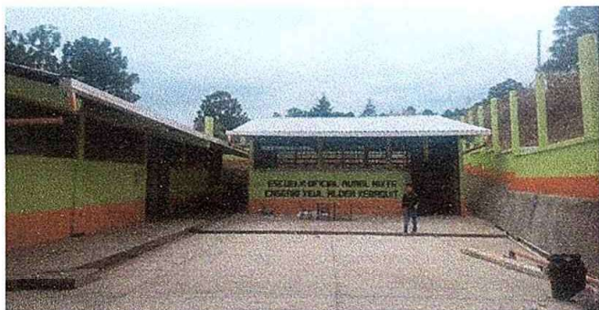
Modulo4. foto7. pinturas en muros interior y exterior

Observación: Si es necesario se pueden agregar hojas adicionales y actualizar el número de hojas.