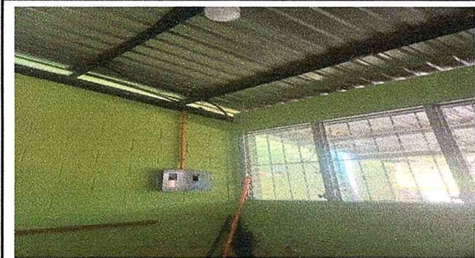
modulo 3. foto. 5 sustitucion de tablero de filfones e Instalacion de filfones