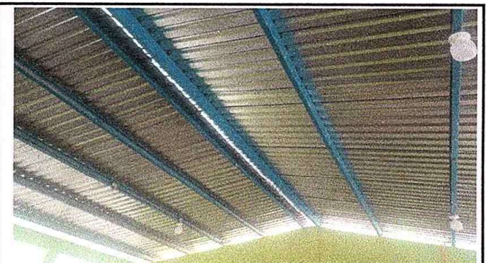
Modulo 1: Foto. 4. Sustitución de lámparas de 2x40, reparación del cableado eléctrico e instalación de unidades de luz.