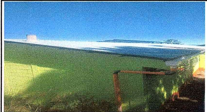
Modulo 2: foto. 1 Sustitución de canal pvc y reparación de bajada de agua pluvial pvc 3.