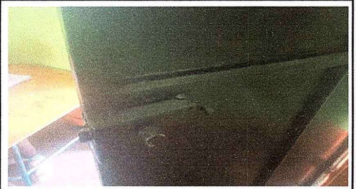
Modulo 3: foto 6 Sustitucion de chapa y mantenimiento a estructura.