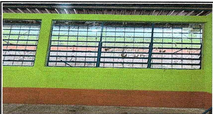
Modulo 1: Foto. 5 Sustitución de vidrio