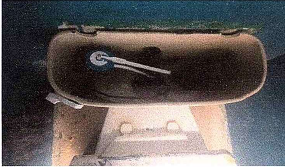
modulo 4: fot.3 Sustitucion de accesorio inodoro. (contrallave, tubo de abasto y tanque)