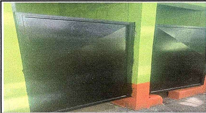
Modulo 4: fot.5 Mantenimiento a estructura de puerta (lijado, cepillado y pintado)