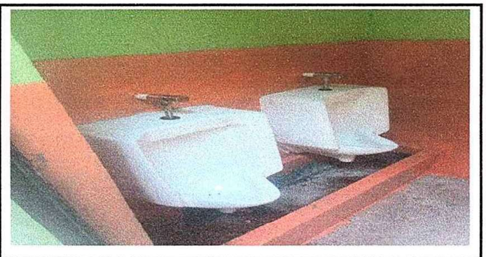
Modulo 4: fot.2Sustitución de mingitorio

Observación: Si es necesario se pueden agregar hojas adicionales y actualizar el número de hojas.