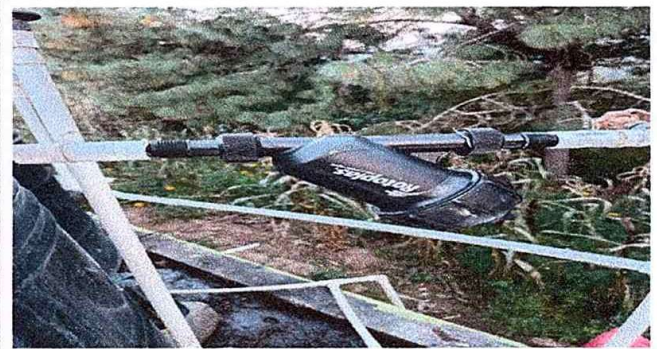
modulo 4. fot.6 sustitucion de filtro para llenado de deposito rotoplas y accesorio.