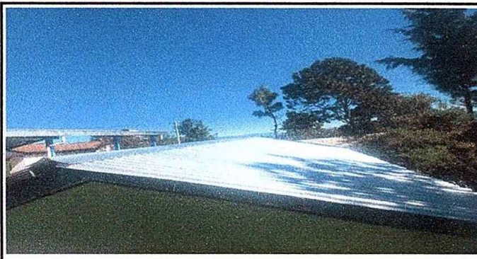
Modulo 3: foto1 Sustitucion de lámina, por lamina troquelada aluzinc calibre 26, sustitucion de capote de lamina, sustitucion de elementos de fijación (tornillos)