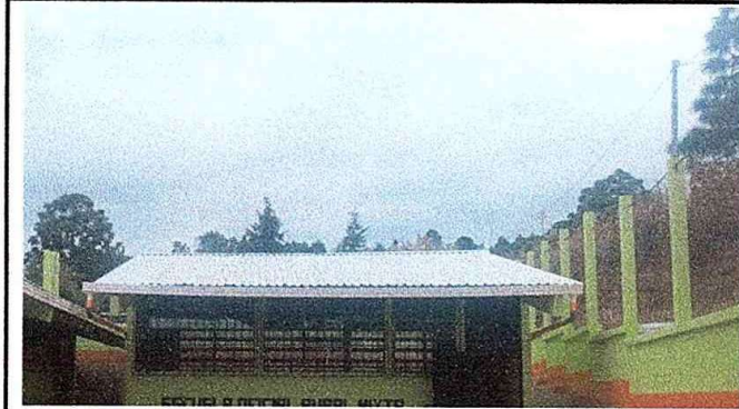
Modulo 1: Foto. 1 Sustitución de lámina, por lámina troquelada al zinc calibre 26, sustitución de capote de lámina y sustitución de elementos de fijación (tornillos)