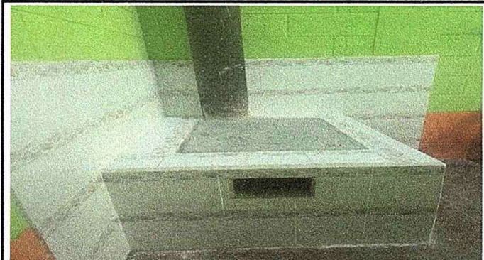
Modulo 2: foto 3. Mantenimiento a estufa rural, instalacion de azulejo estufa rural y Sustitucion de plancha de metal 3 hornillos