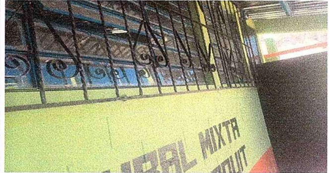
Modulo 1: Foto 2. Mantenimiento a balcones de metal.