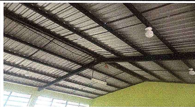
Modulo 2: foto. 2sustitucion de lámpara de 2x40, reparación de cableado eléctrico e instalación de unidades luz.