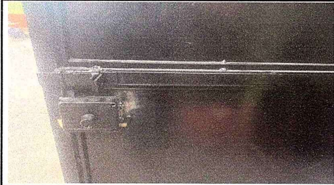
MODULO1. foto7. Sustitucion de Chapa y mantenimiento a estructura de puerta.