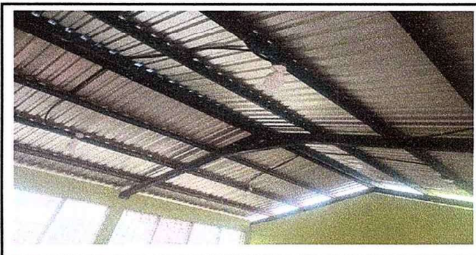
Modulo 3: foto2 sustitucion de lámparas 2x20, reparación de cableado eléctrico, instalacion de unidades de luz.

Observación: Si es necesario se pueden agregar hojas adicionales para actualizar el número de hojas.