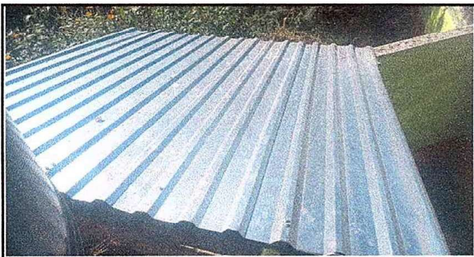
Modulo 4: fot. 1 Sustitución de lámina, por troquelada aluzinc calibre 26, sustitucion de elementos de fijación (tornillos)