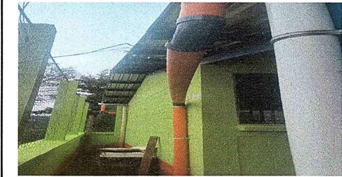
modulo 3: foto3 Sustitución de canal pvc y reparación de bajada de agua pluvial, tubo pvc 3