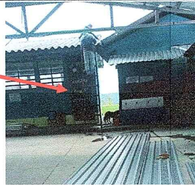
Foto No. 10, Módulo No. 2. Mantenimiento a estructura de puerta (lijado, cambio de tubo) Cepillado, sujeción, aplicación de pintura