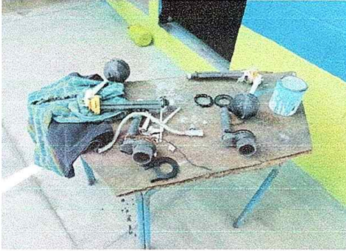
Foto No. 19, Módulo No. 4. Sustitución de accesorios de inodoro (contra llave, manguera de abasto y tanque.