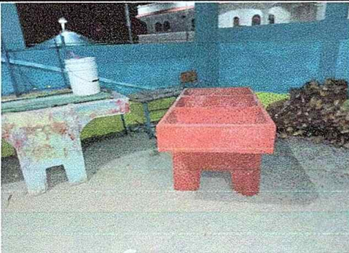
Foto No. 15, Módulo No. 3. Sustitución de pila de cemento de dos lavaderos.