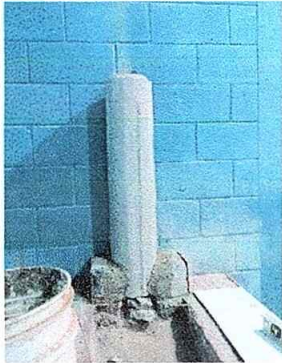
Foto No. 13, Módulo No. 3. Sustitución de chimenea de concreto y sustitución de lámina por lámina troquelada aluzinc calibre 26, desinstalación de lámina.