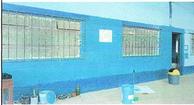
Foto No. 1, Módulo No. 1. Pintura de muros interiores y exteriores.