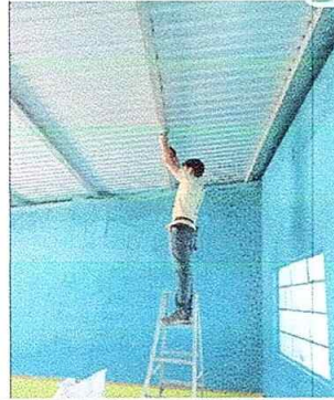
Foto No. 8, Módulo No. 2. Reparación de cableado eléctrico, sustitución de focos ahorradores.