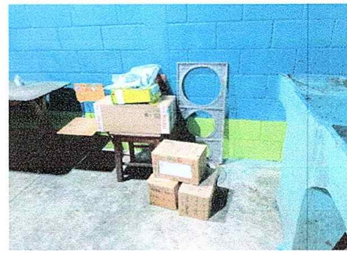
Foto No.14, Módulo No. 3. Sustitución de plancha de metal de 3 hornillas e instalación de azulejo en estufa rural y sustitución de chimenea de concreto.