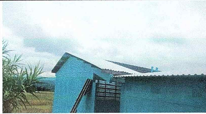
Foto No. 7, Módulo No. 2. Sustitución de lámina, por lámina troquelada aluzinc calibre 26, desinstalación de lámina.