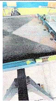
Foto No. 18, Módulo No. 3. Mantenimiento a estructura de puerta (lijado, cepillado, pintado)

Observación: Si es necesario se pueden agregar hojas adicionales y actualizar el número de hojas.