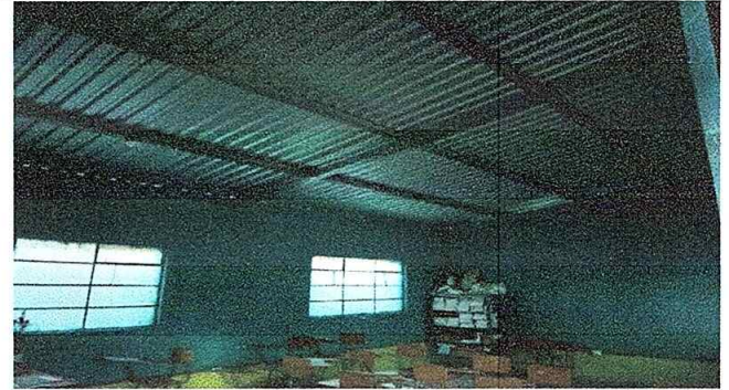
Foto No. 2, Módulo No. 1. Reparación de cableado eléctrico, sustitución ducto eléctrico más accesorios, sustitución de tomacorrientes, sustitución de focos ahorradores, mantenimiento a estructura de puerta (lijado, cepillado)