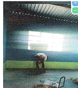
Foto No. 6, Módulo No. 1. Mantenimiento a estructura de puerta (lijado, cambio de tubo. Cepillado, sujeción, aplicación de pintura

Observación: Si es necesario se pueden agregar hojas adicionales y actualizar el número de hojas.