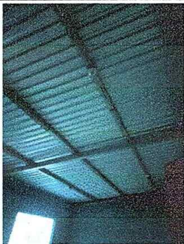
Foto No. 5, Módulo No. 1. Reparación de cableado eléctrico, sustitución ducto eléctrico más accesorios, sustitución de tomacorrientes, sustitución de focos ahorradores,