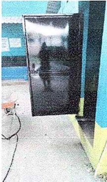
Foto No. 21, Módulo No. 4. Mantenimiento a estructura de puerta (lijado, cambio de tubo. Cepillado, sujeción, aplicación de pintura