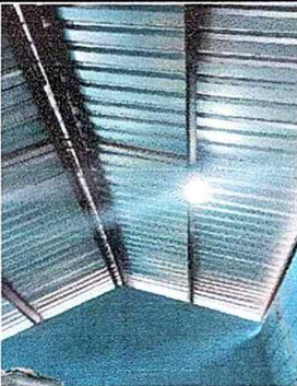
Foto No. 17, Módulo No. 3, sustitución de lámina por lámina troquelada aluzinc calibre 26, desinstalación de lámina. Sustitución de elementos de fijación (tornillos), sustitución de capotes de lámina para lámina