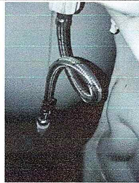
Foto No. 22, Módulo No. 4. Sustitución de accesorios de inodoro (contra llave, manguera de abasto y tanque.