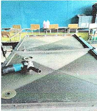
Foto No. 3, Módulo No. 1. Mantenimiento a estructura de puerta (lijado, cepillado)