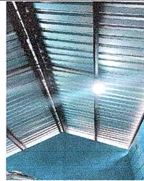
Foto No. 16, Módulo No. 3. Sustitución de focos ahorradores, sustitución de plafoneras, sustitución de tomacorrientes.