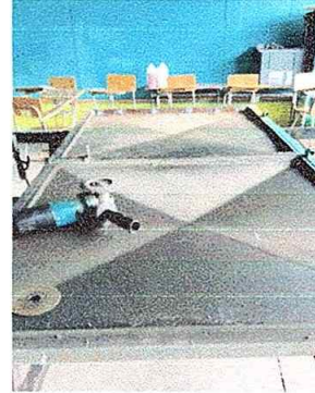
Foto No. 20, Módulo No. 4. Mantenimiento a estructura de puerta (lijado, cambio de tubo. Cepillado, sujeción, aplicación de pintura