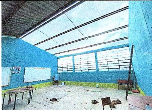
Foto No.9, Módulo No. 2. Sustitución de lámina, por lámina troquelada