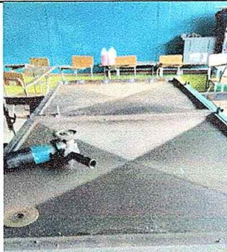
Foto No. 11, Módulo No. 2. Mantenimiento a estructura de puerta (lijado, cambio de tubo) Cepillado, sujeción, aplicación de pintura