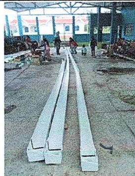
Foto No. 12, Módulo No. 2. Sustitución de canal de canal pvc.

Observación: Si es necesario se pueden agregar hojas adicionales y actualizar el número de hojas.