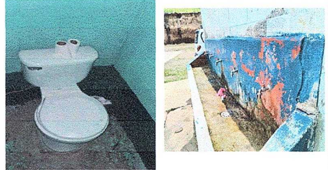
Foto 2: Modulo 2. Sustitución de hinodoros y sustitución de lavamanos