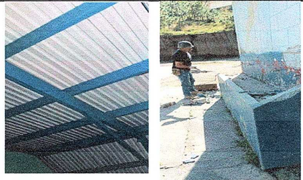
Foto 4: Modulo 3. Sustitución de lamina por lamina troquelada calibre 26 y aluzin sustitucion de lavamanos.