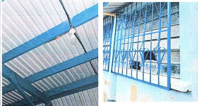
Foto1: Modulo 1. Sustitución a instalación de balcones de hierro en ventana y sustitución de plafoneras