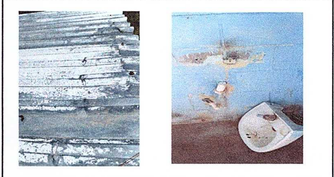
Foto 4: Modulo 3. sustitucion de lamina por lamina troquelada aluzinc calibre 26 y sustitución de lavamanos.