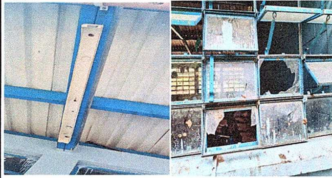
Foto1: Modulo 1. Suministro e instalacion de balcones de hierro en ventana y sustitucion de plafoneras