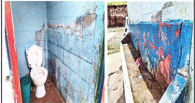
Foto 2: Modulo 2 Sustitución de hinodoros y sustitucion de lavamanos