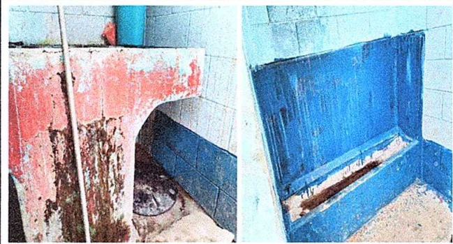
Foto 3: Modulo 2. sustitucion de pila de cemento de dos lavaderos y sustitucion de urinal por mingitorios