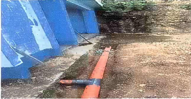
FOTO 15 MODULO 3 TUBERÍA PVC Y ACCESORIOS