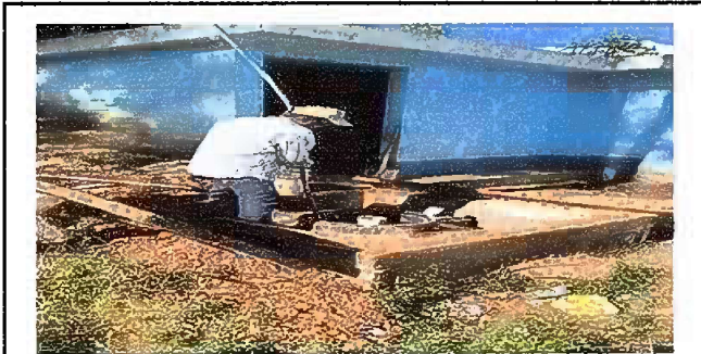
FOTO 9 MODULO 2 LIMPIEZA DE BIODIGESTOR