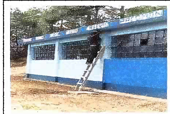
FOTO 8 MODULO 2 PINTURA DE MUROS