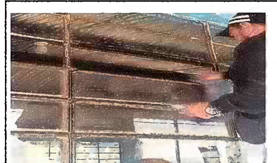
FOTO 10 MODULO 2 SUSTITUCIÓN DE VIDRIOS