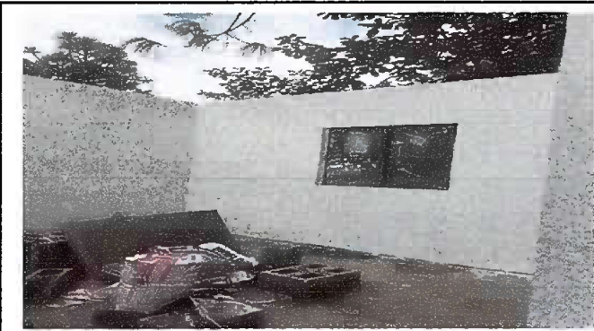
FOTO 3 MODULO 1 CERNIDO EN MURO REPELLO Y