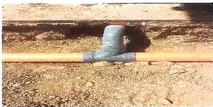
FOTO 17 MODULO 3 TUBERÍA AGUAS PLUVIALES