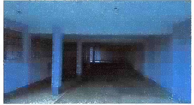
FOTO 14 MODULO 3 PINTURA GENERAL