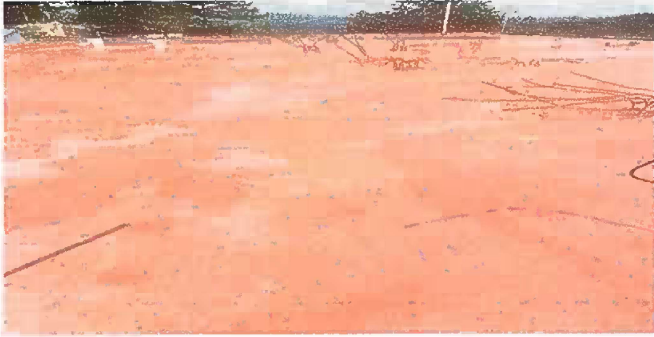
FOTO 13 MODULO 3 IMPERMEABILIZACIÓN DE LOSA