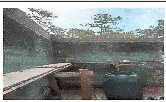
FOTO 2 MODULO 1 SUSTITUCIÓN DE ESTRUCTURA DE SOPORTE COSTANERAS