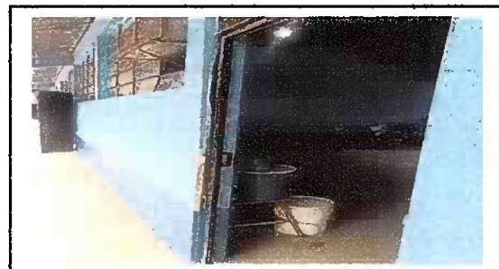
FOTO 12 MODULO 2 SUSTITUCIÓN DE PUERTA

Observación: Si es necesario se pueden agregar hojas adicionales y actualizar el número de hojas.