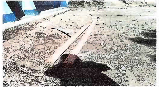
FOTO 16 MODULO 3 SUSTITUCIÓN DE TUBERÍA PVC AGUAS PLUVIALES