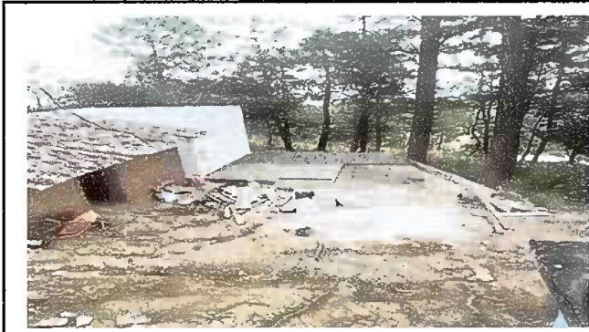
FOTO 7 PATIO REPARACIÓN DE PLANCHAS DE CONCRETO DE PATIO