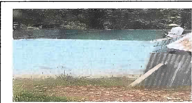
FOTO 1 MODULO 1 SUSTITUCIÓN DE LAMINA