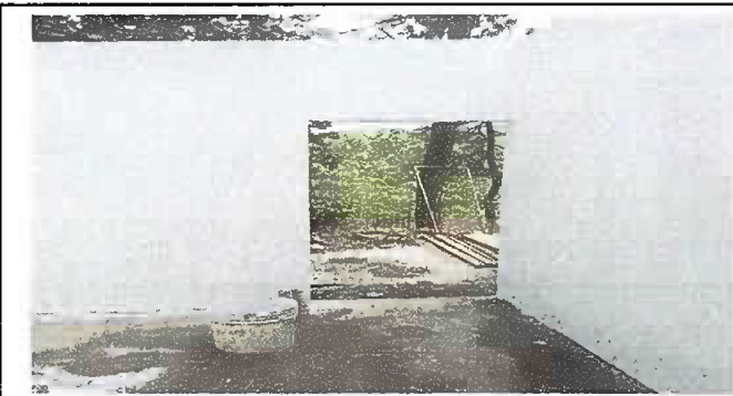
FOTO 5 MODULO 1 DE PUERTA SUSTITUCIÓN