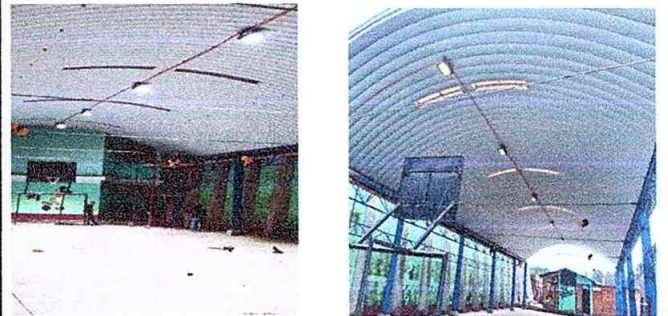
Foto 6: Modulo 2. Cancha polideportiva. Reparación de cableado eléctrico y sustitución de lámparas.

Observación: Si es necesario se pueden agregar hojas adicionales y actualizar el número de hojas.