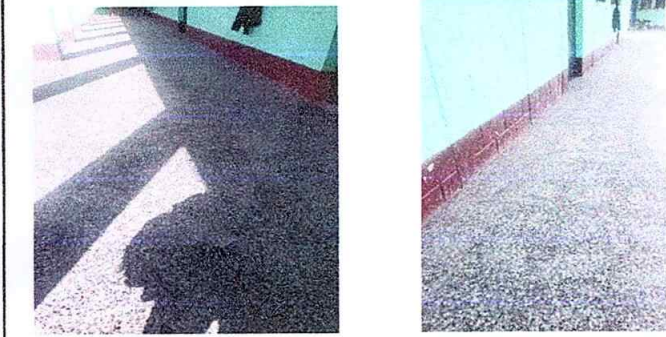
Foto1: MODULO 1 Sustitución de piso de torta de concreto en el pasillo