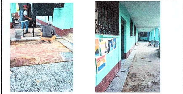
Foto1: MODULO 1 Sustitución de piso de torta de concreto en el pasillo